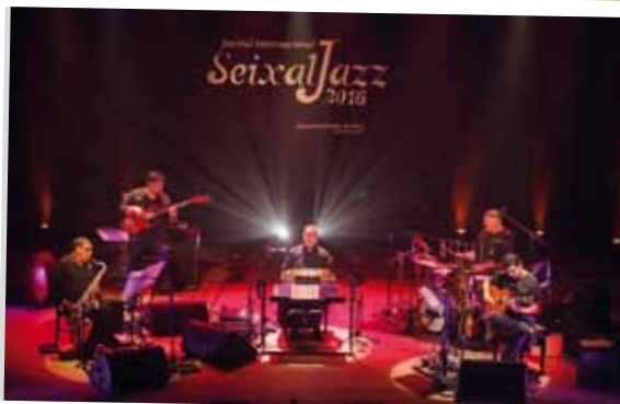
Festival Internacional SeixalJazz

O objetivo desta iniciativa é mostrar e apoiar o trabalho que o movimento associativo realiza na área cultural e divulgar o seu papel na formação cultural e desenvolvimento artístico da população.