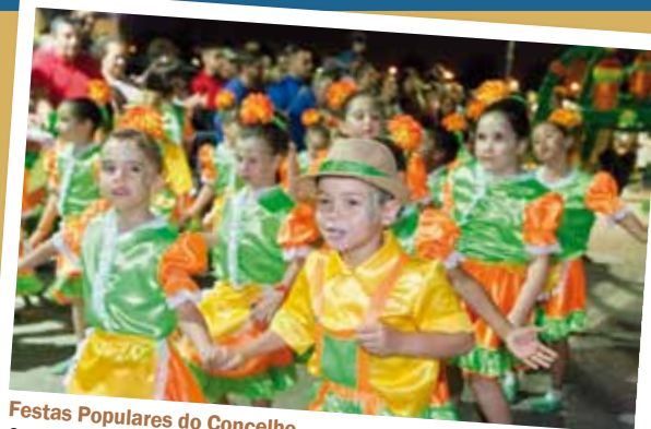
Festas Populares do Concelho Começam em junho e terminam em setembro, percorrendo todas as freguesias. Contam com programas diversificados com música, dança, animação, feira franca e mantêm tradições como marchas populares, garraíadas, cavalhadas e festivais de folclore.

A Mostra Cultural Associativa, Apre(e)nder o Teatro, O Livro em Festa – Feira do Livro no Seixal, o Maio Património, o Festival Internacional SeixalJazz, a Gala S. Vicente dos Pequenos Cantores, as Festas Populares do Concelho, o Seixal World Music e o Festival de Teatro do Seixal são iniciativas emblemáticas, que fazem parte do programa cultural do concelho.