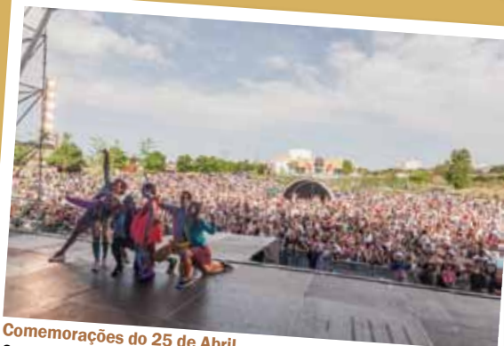
Comemorações do 25 de Abril

Este projeto estimula a produção de música portuguesa e incentiva o aparecimento de novos compositores e intérpretes dos 5 aos 16 anos do distrito de Setúbal.