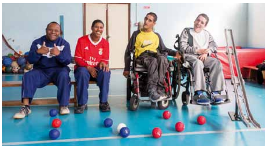
Boccia. Cooperativa para a Educação e Reabilitação de Cidadãos Inadaptados do Seixal e Almada (CERCISA)