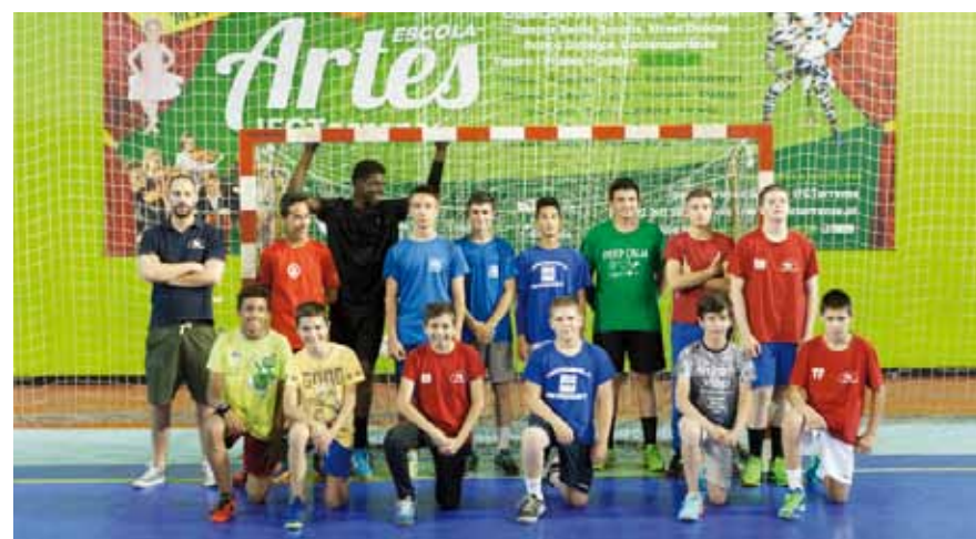
Andebol. Independente Futebol Clube Torrense, Centro Cultural e Recreativo do Alto do Moinho e Centro de Solidariedade Social de Pinhal de Frades