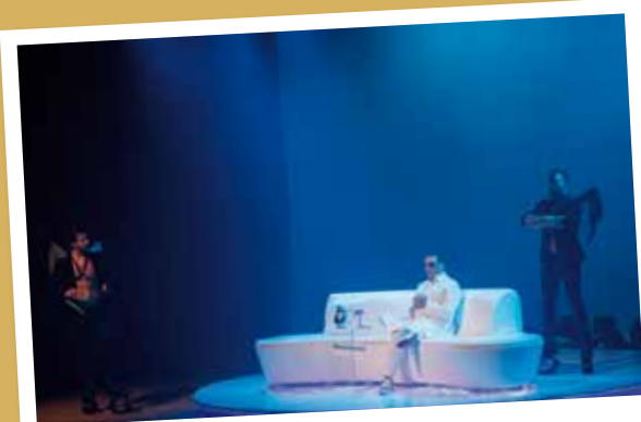
Festival de Teatro do Seixal

Programa de iniciativas que engloba concertos, exposições, visitas temáticas, concertos e outras de forma a celebrar o património do concelho e dinamizar os vários espaços museológicos.