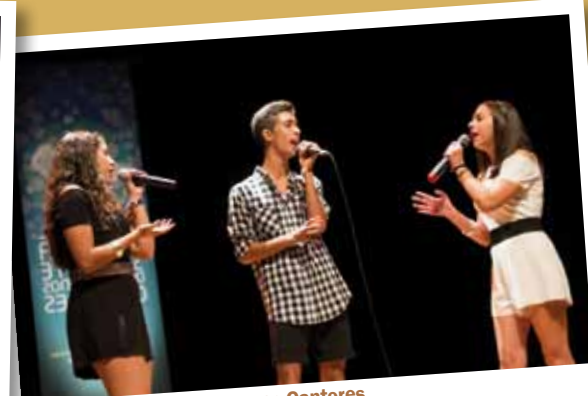
Gala S. Vicente dos Pequenos Cantores

Um festival que é considerado um dos mais emblemáticos do género em Portugal e por onde passaram nomes como Colin Stetson, Dino Saluzzi, Paulus Schäfer Trio, Carlos Bica Trio Azul, Craig Taborn, Mário Laginha e The Mingus Project, entre outros.