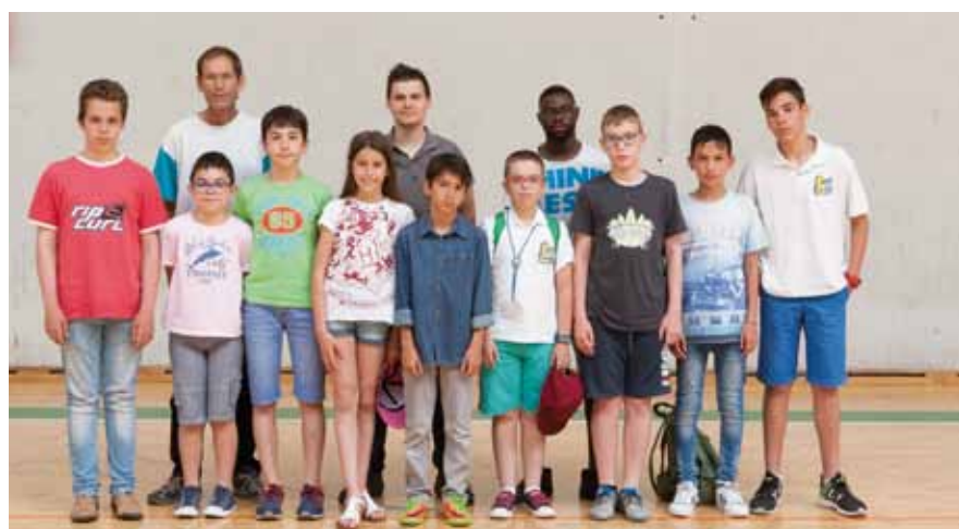
Xadrez. Independente Futebol Clube Torrense, Centro Cultural e Recreativo do Alto do Moinho e Clube Recreativo da Cruz de Pau