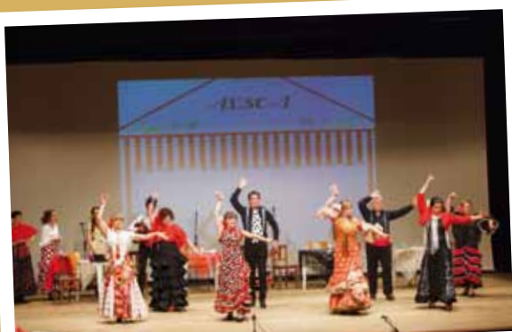
Mostra Cultural Associativa

O objetivo desta iniciativa é mostrar e apoiar o trabalho que o movimento associativo realiza na área cultural e divulgar o seu papel na formação cultural e desenvolvimento artístico da população.