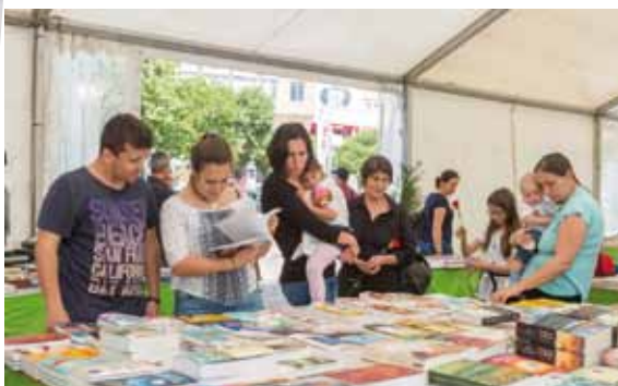
O Livro em Festa – Feira do Livro no Seixal

O programa de comemorações inclui várias iniciativas desportivas e culturais do qual se destacam a saudação ao Poder Local Democrático e ao 25 de Abril, com a participação das bandas filarmónicas do concelho, e os concertos na noite de 24 de abril. Nos últimos anos, atuaram no Seixal Agir, Deolinda, D.A.M.A., Paulo de Carvalho, Carlos do Carmo e Xutos & Pontapés.