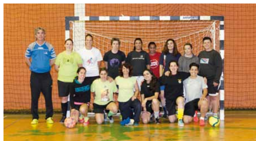
Futsal feminino. Clube Associativo Desportivo Cinza Fénix e Grupo Desportivo e Recreativo da Quinta da Princesa