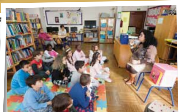
Estação do Livro

Projeto que reúne várias iniciativas na área do teatro, nomeadamente a comemoração do Dia Mundial do Teatro e Dia Mundial da Criança. Inclui também a Mostra de Teatro Escolar, com apoios à criação de espetáculos nas escolas.