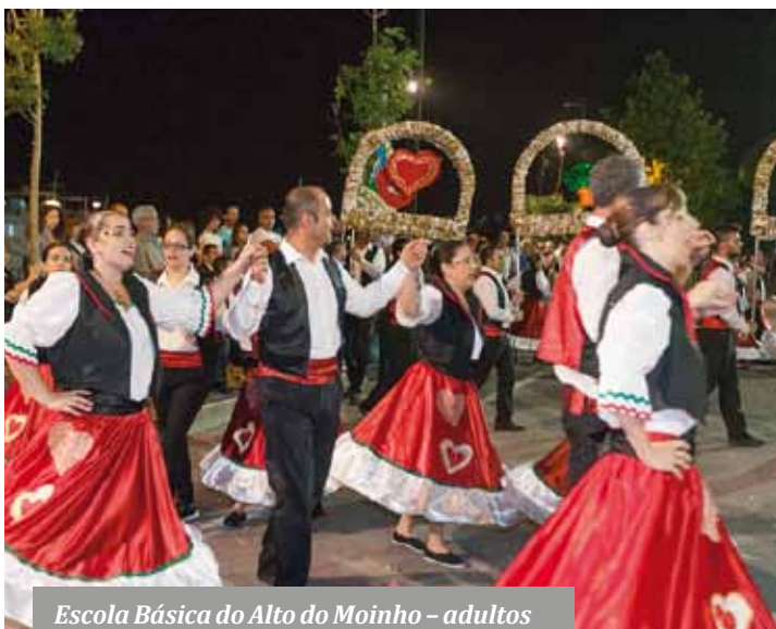
Escola Básica do Alto do Moinho – adultos