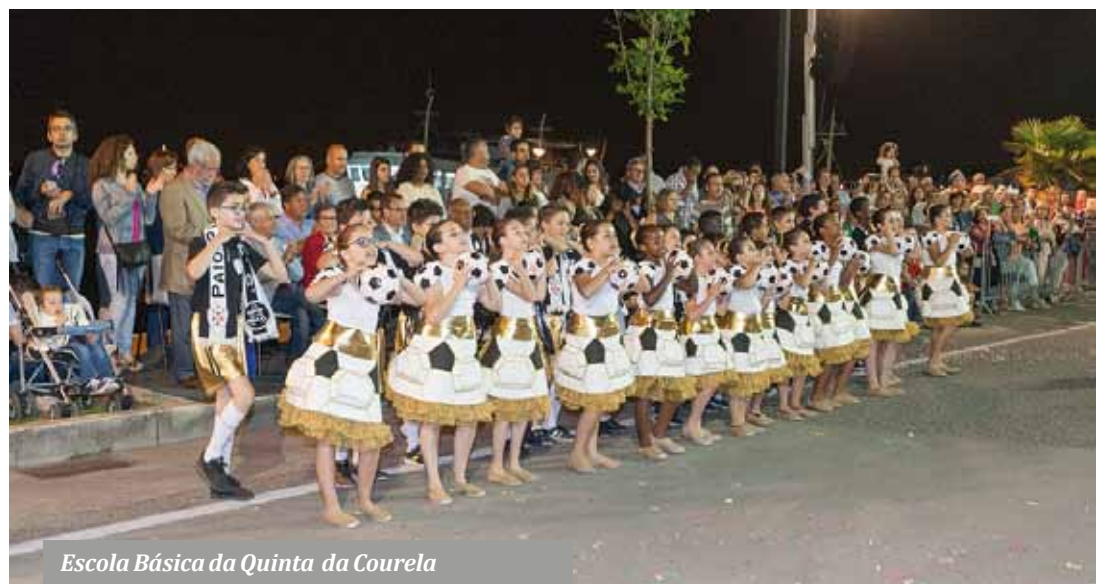
Escola Básica da Quinta da Courela