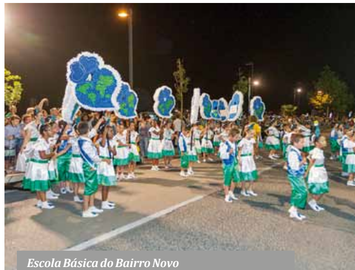
Escola Básica do Bairro Novo