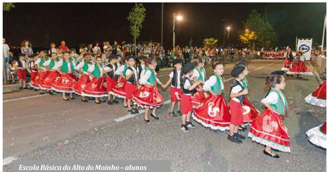
Escola Básica do Alto do Moinho – alunos