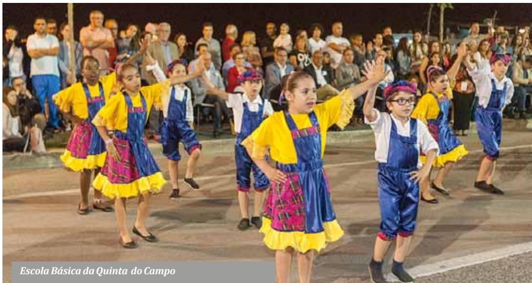
Escola Básica da Quinta do Campo