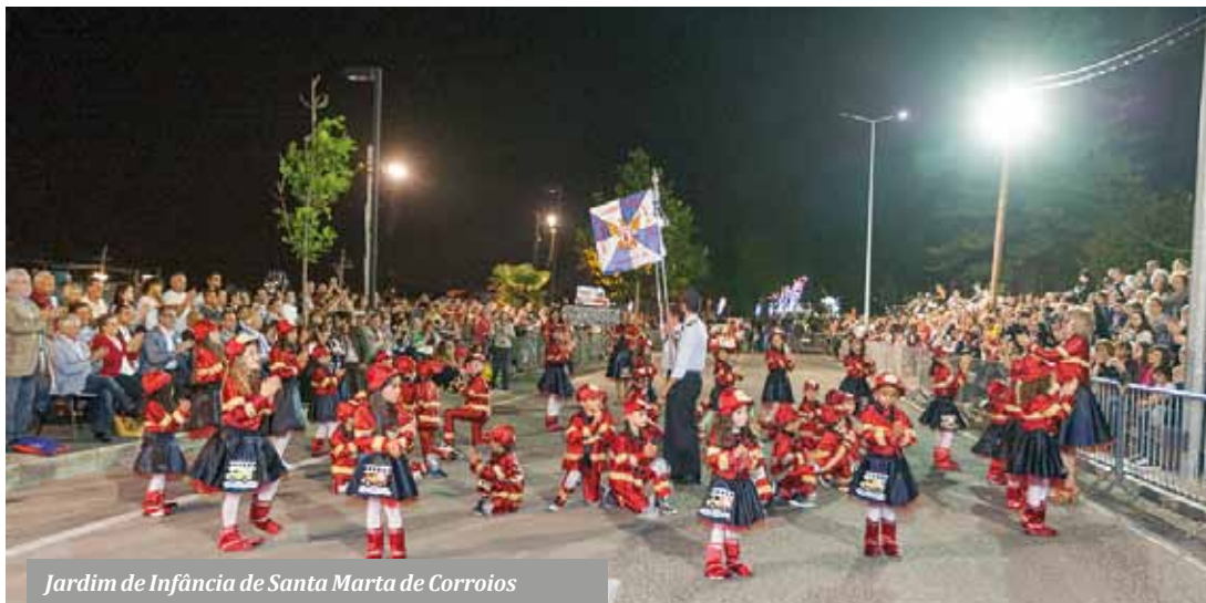
Jardim de Infância de Santa Marta de Corroios