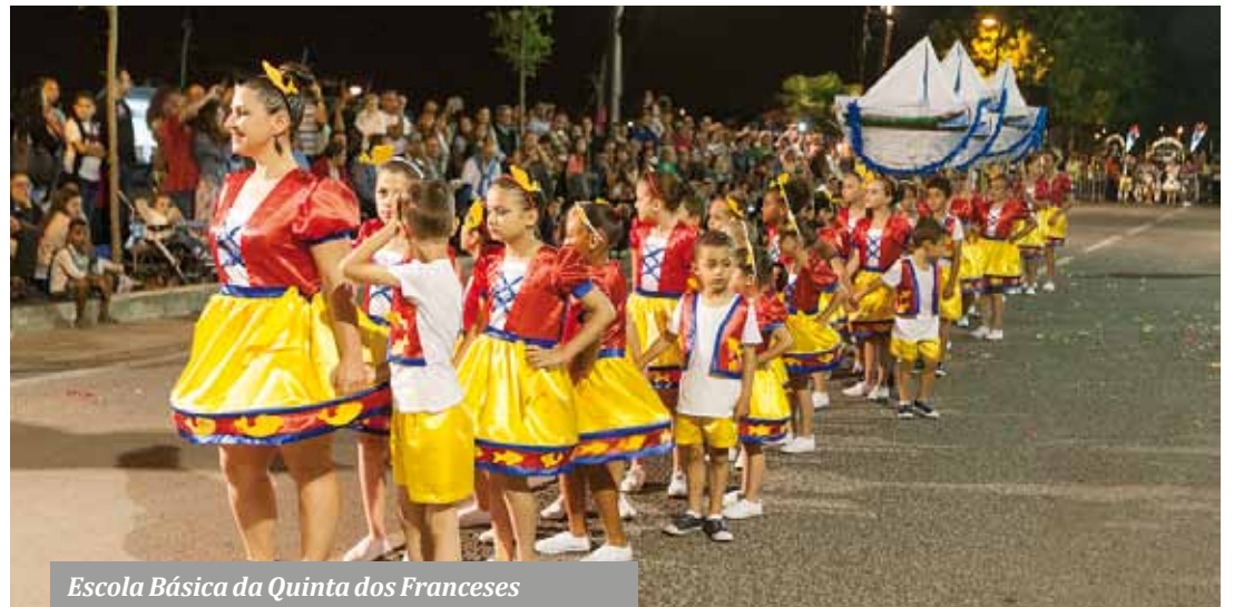
Escola Básica da Quinta dos Franceses

A coreografia muito elaborada da Escola Básica do Alto do Moinho incluiu numa primeira apresentação a marcha das crianças e depois a dos adultos, num total de 40 pares. Marcharam ao som do tema «É Portugal – Viva a Marcha...». ■