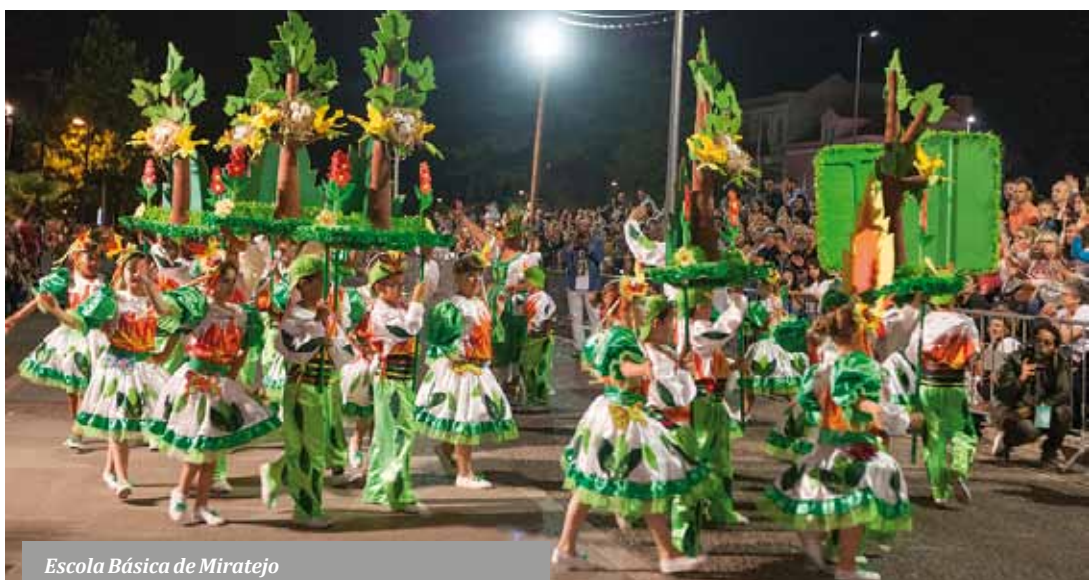
Escola Básica de Miratejo