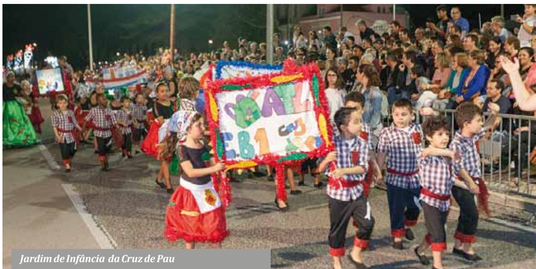
Jardim de Infância da Cruz de Pau