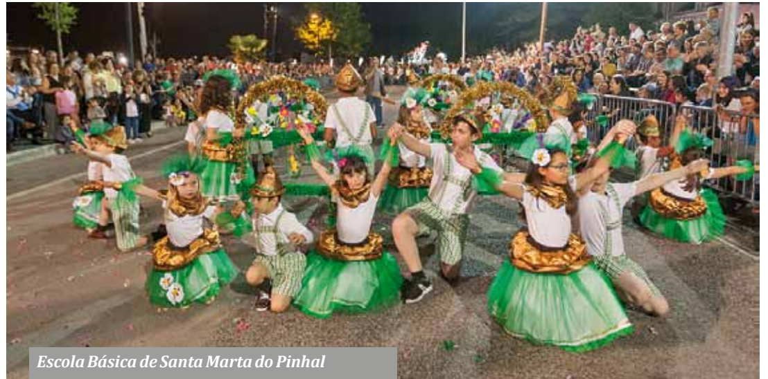
Escola Básica de Santa Marta do Pinhal