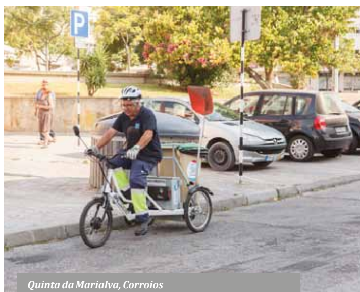
Quinta da Marialva, Corroios