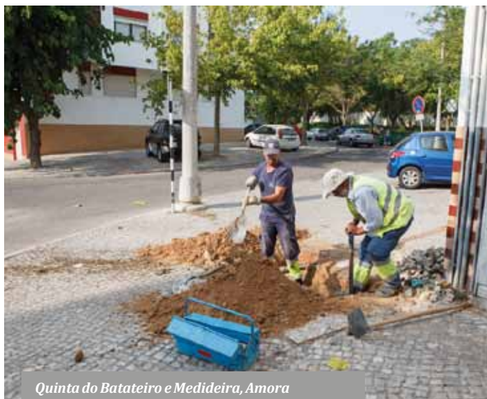
Quinta do Batateiro e Medideira, Amora