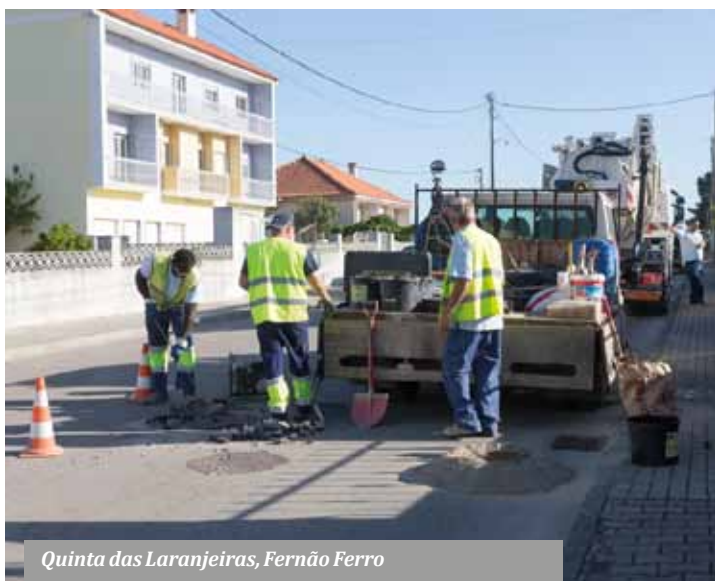
Quinta das Laranjeiras, Fernão Ferro