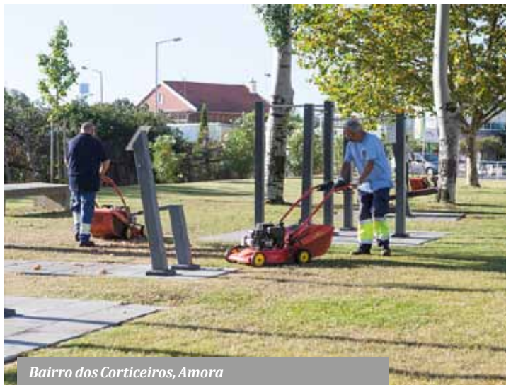
Bairro dos Corticeiros, Amora