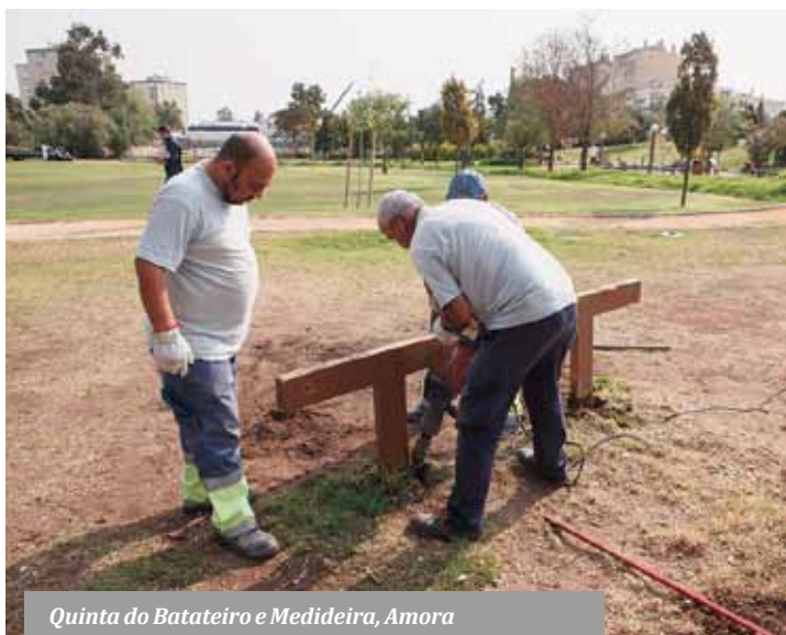
Quinta do Batateiro e Medideira, Amora