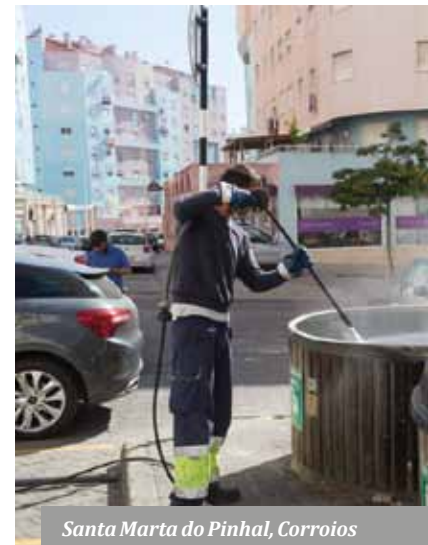
Santa Marta do Pinhal, Corroios