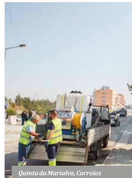
Quinta da Marialva, Corroios

Ações integradas de valorização do espaço público