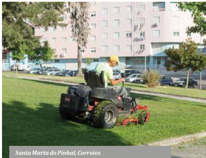
Santa Marta do Pinhal, Corroios