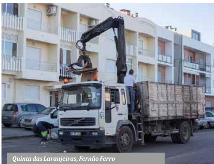
Quinta das Laranjeiras, Fernão Ferro