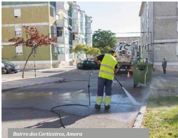
Bairro dos Corticeiros, Amora