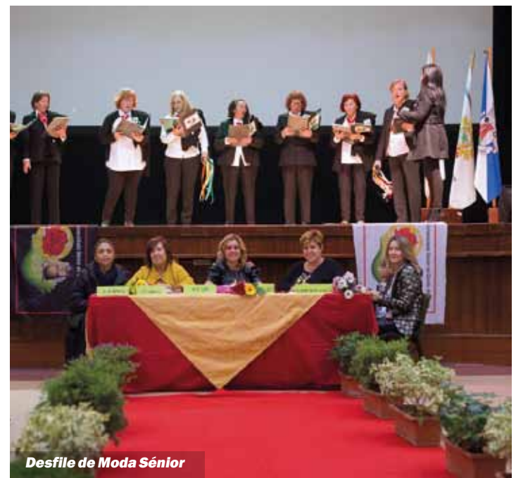
Desfile de Moda Sénior

A moda também foi um dos momentos altos do programa, com o Desfile de Moda Sénior, organizado pela Associação Love Project e Movimento Utopia Global, no dia 9 de novembro, na Sociedade Filarmónica Operária Amorense.