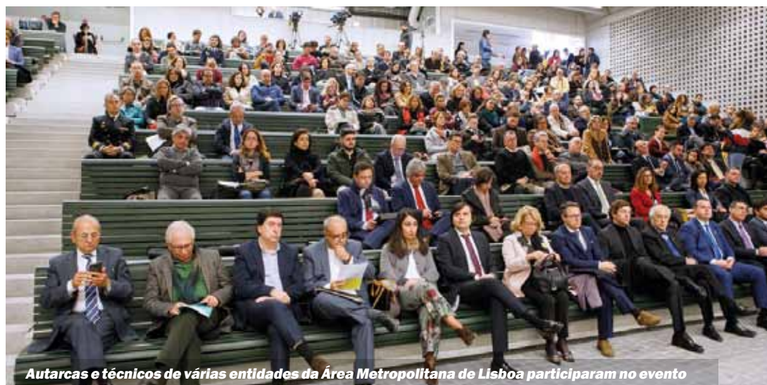
Autarcas e técnicos de várias entidades da Área Metropolitana de Lisboa participaram no evento