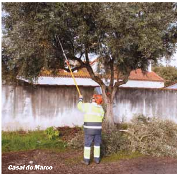
Casal do Marco