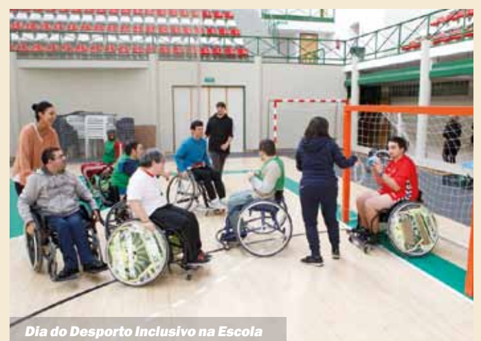
Dia do Desporto Inclusivo na Escola