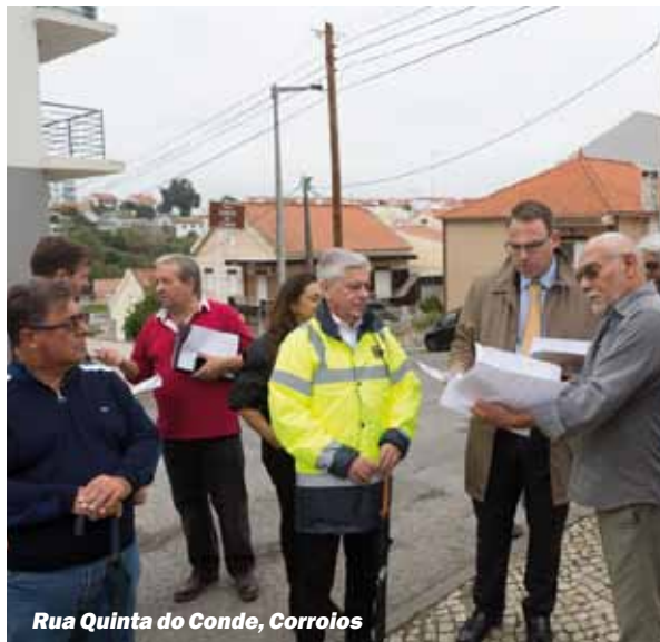
Rua Quinta do Conde, Corroios