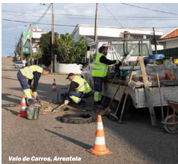
Vale de Carros, Arrentela