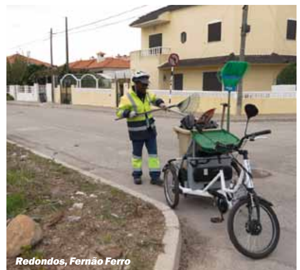
Redondos, Fernão Ferro