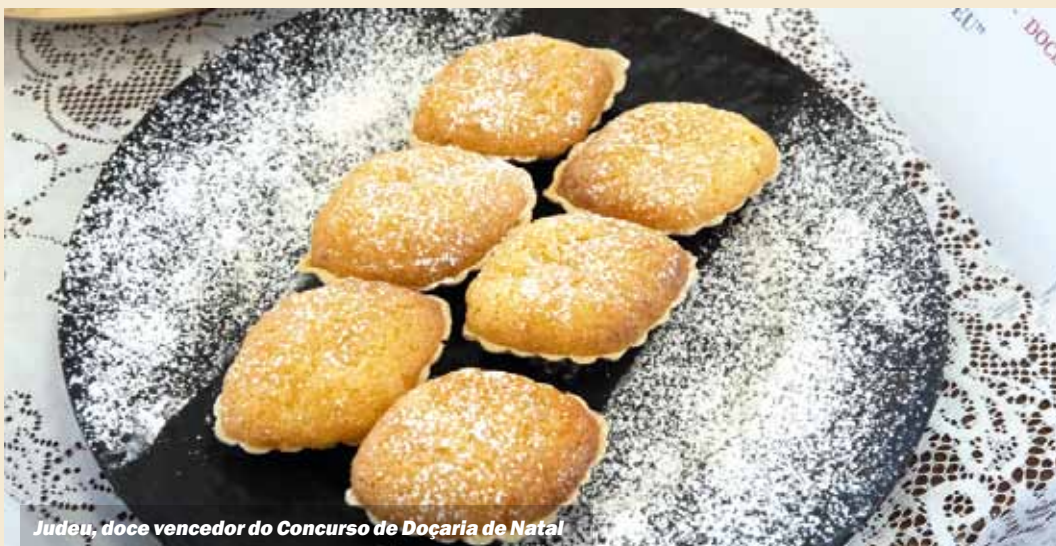
Judeu, doce vencedor do Concurso de Doçaria de Natal