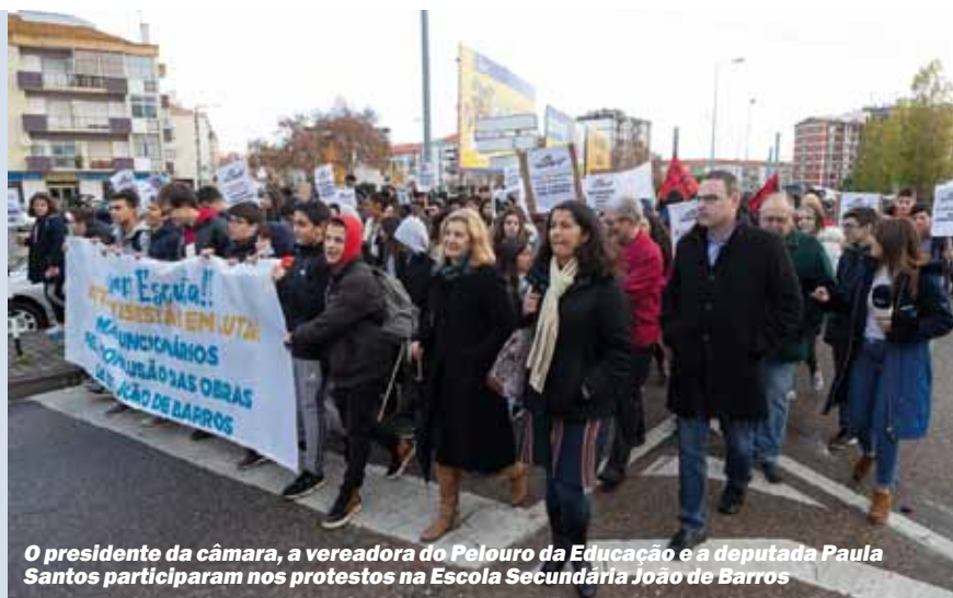
O presidente da câmara, a vereadora do Pelouro da Educação e a deputada Paula Santos participaram nos protestos na Escola Secundária João de Barros