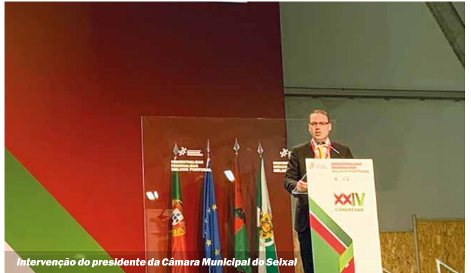
Intervenção do presidente da Câmara Municipal do Seixal

Aprofundar e valorizar o conhecimento dos projetos educativos municipais e intermunicipais, enquanto projetos de contexto, propiciadores de condições de promoção do sucesso educativo e contribuir para a construção da identidade regional, nos planos educativo, cultural e social, foram os objetivos do encontro. ■