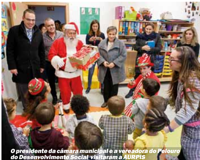
O presidente da câmara municipal e a vereadora do Pelouro do Desenvolvimento Social visitaram a AURPIS