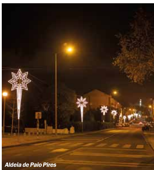
Aldeia de Paio Pires