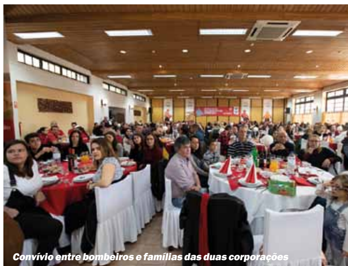
Convívio entre bombeiros e famílias das duas corporações