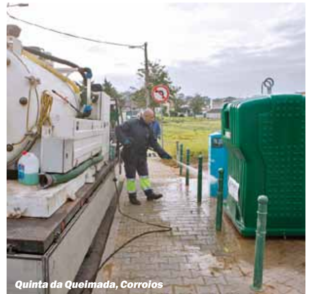
Quinta da Queimada, Corroios