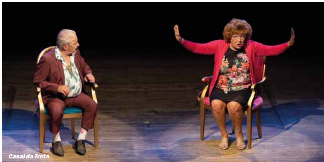
Casal da Treta