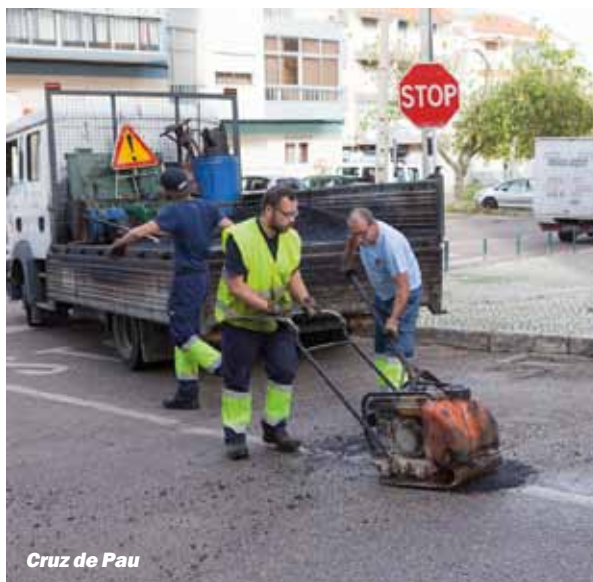
Cruz de Pau