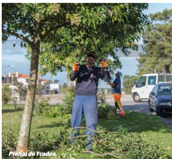
Pinhal de Frades