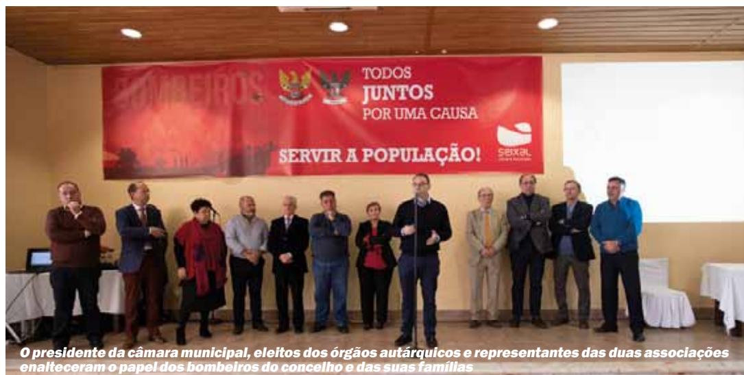
O presidente da câmara municipal, eleitos dos órgãos autárquicos e representantes das duas associações enalteceram o papel dos bombeiros do concelho e das suas famílias

Convívio junta as duas corporações do concelho