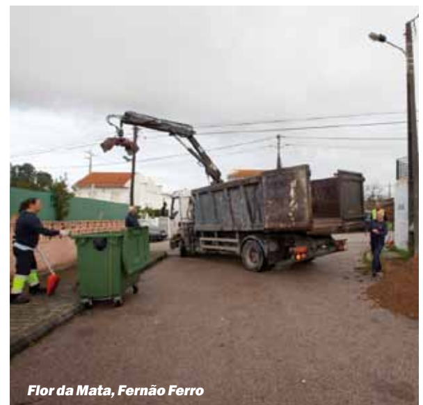
Flor da Mata, Fernão Ferro