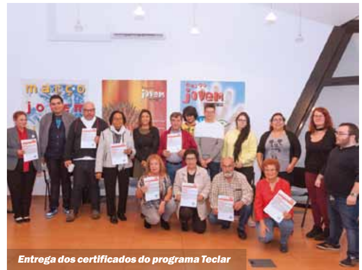
Entrega dos certificados do programa Teclar