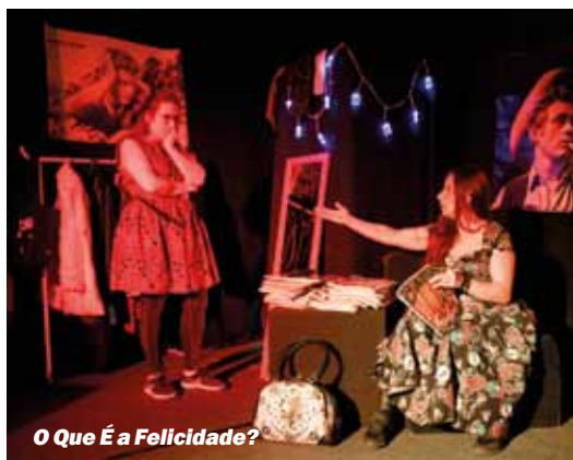
O Que É a Felicidade?