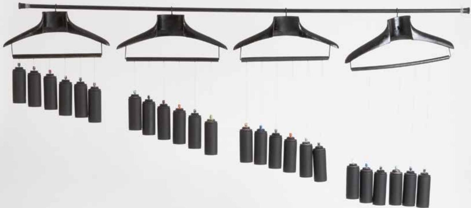
CORTINA MUSICAL técnica mista, 120x70x10 cm, 2017