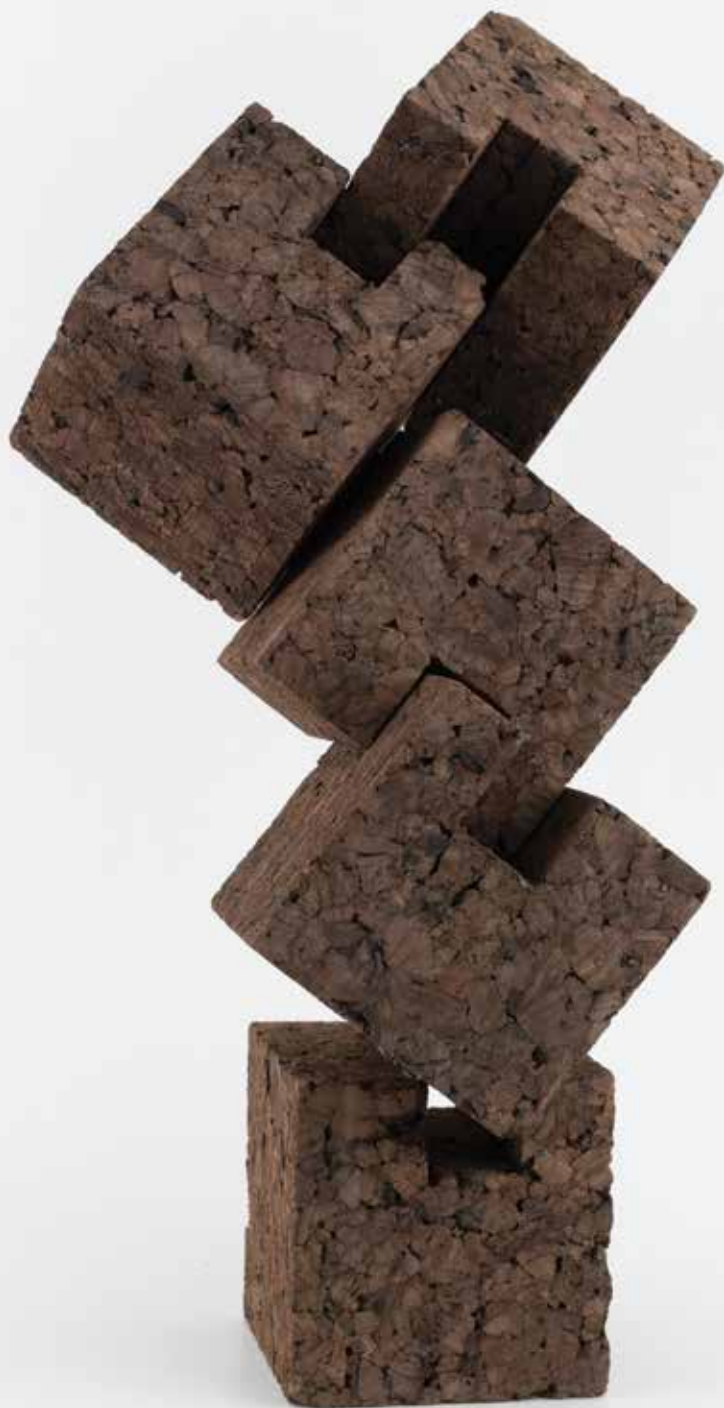
AFETOS cortiça, 2019