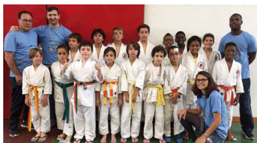
Judo _Centro Cultural e Desportivo das Paivas, Judo Clube do Sul e Portugal Cultura e Recreio