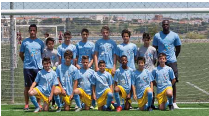
Futebol de 7 _Paio Pires Futebol Clube, Atlético Clube de Arrentela, Amora Futebol Clube, Leão Altivo Associação, CAAF – Associação de Futebol do Colégio Atlântico e Academia Clube Desportivo de Corroios