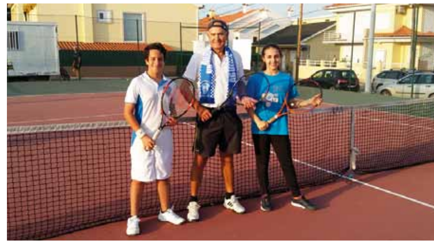
Ténis de campo _Clube Desportivo e Recreativo Águias Unidas