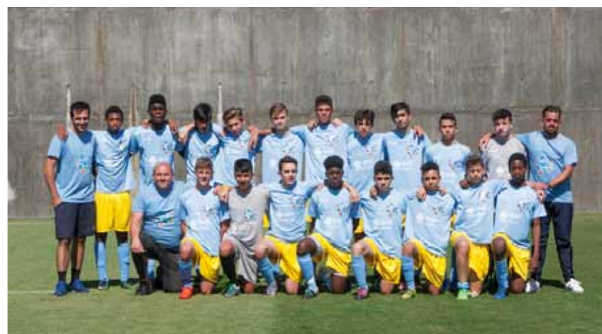
Futebol de 11 _Atlético Clube de Arrentela, Amora Futebol Clube e Paio Pires Futebol Clube

O Seixal participou nos Jogos do Futuro com 22 seleções que competiram em 20 modalidades. Nos últimos números do Seixal Boletim Municipal temos vindo a apresentar todas as equipas que representaram o concelho neste evento, faltando apenas os coletivos do ténis de campo, judo, futebol de 11 e futebol de 7.