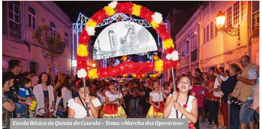
Escola Básica da Quinta da Courela – Tema: «Marcha dos Operários»

Uma réplica do varino Amoroso abriu o desfile da Escola Básica D. Nun'Álvares Pereira, pois foi o tema escolhido para ser representado pelos 30 alunos desta escola. ■