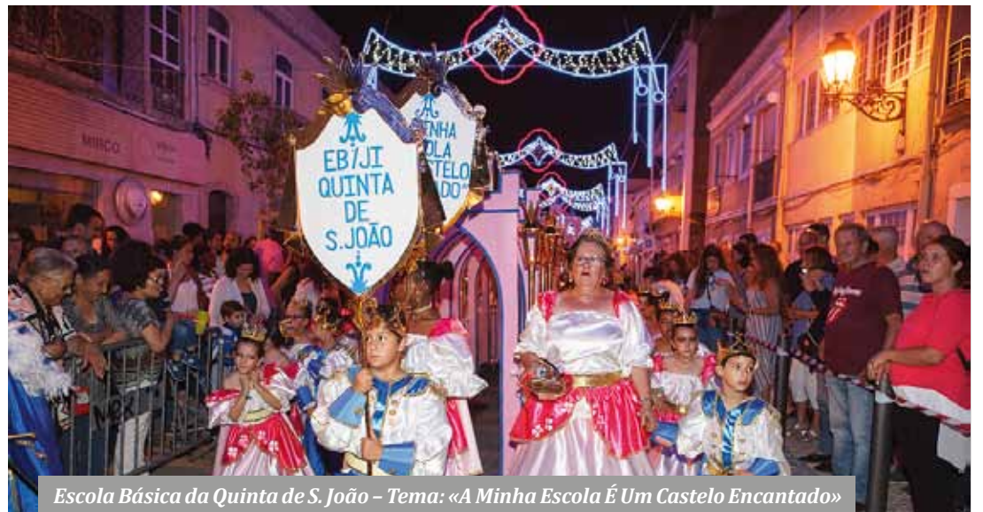
Escola Básica da Quinta de S. João – Tema: «A Minha Escola É Um Castelo Encantado»