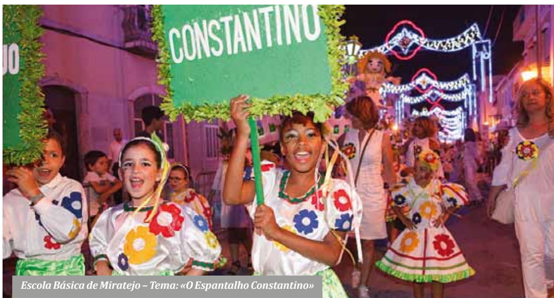
Escola Básica de Miratejo – Tema: «O Espantalho Constantino»