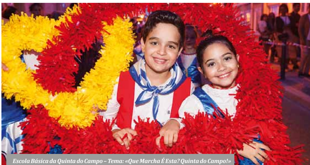
Escola Básica da Quinta do Campo – Tema: «Que Marcha É Esta? Quinta do Campo!»