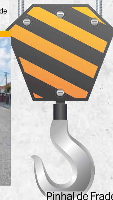
Pinhal de Frades