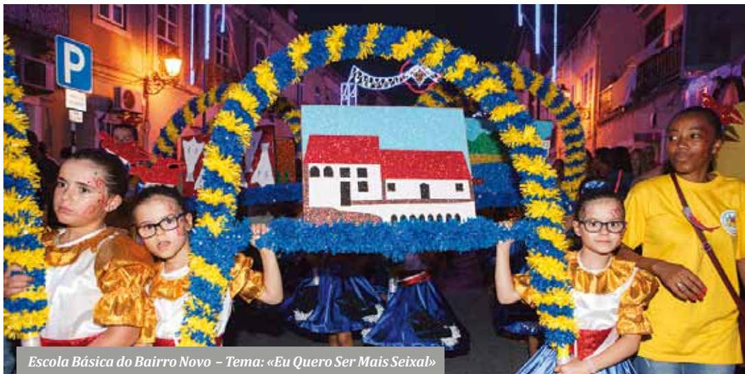
Escola Básica do Bairro Novo – Tema: «Eu Quero Ser Mais Seixal»