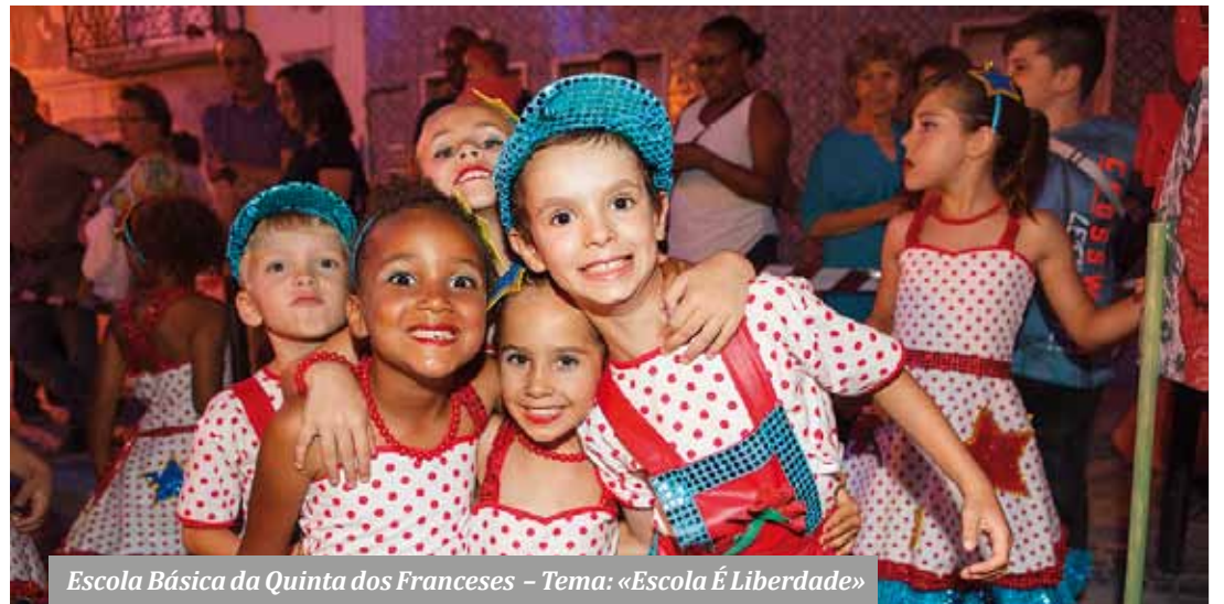
Escola Básica da Quinta dos Franceses – Tema: «Escola É Liberdade»