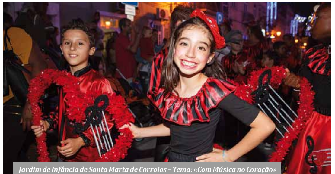
Jardim de Infância de Santa Marta de Corroios – Tema: «Com Música no Coração»