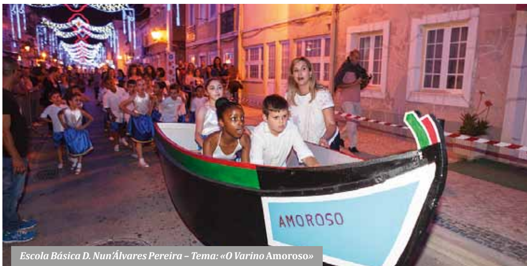
Escola Básica D. Nun'Álvares Pereira – Tema: «O Varino Amoroso»