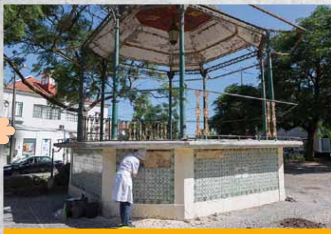
Sociedade Musical 5 de Outubro, Aldeia de Paio Pires