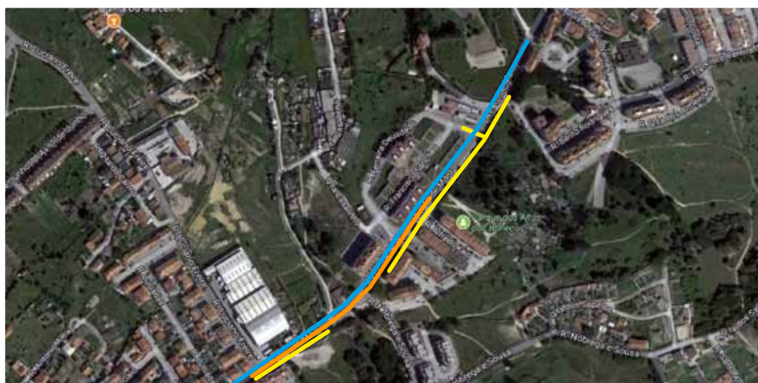
— rede viária — rede de abastecimento de água — rede de drenagem