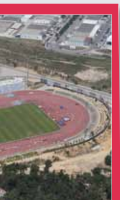
do Pinhal sacramento