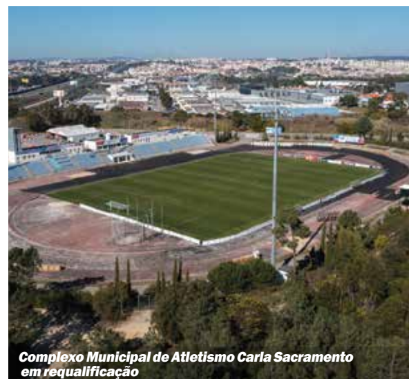
Complexo Municipal de Atletismo Carla Sacramento em requalificação