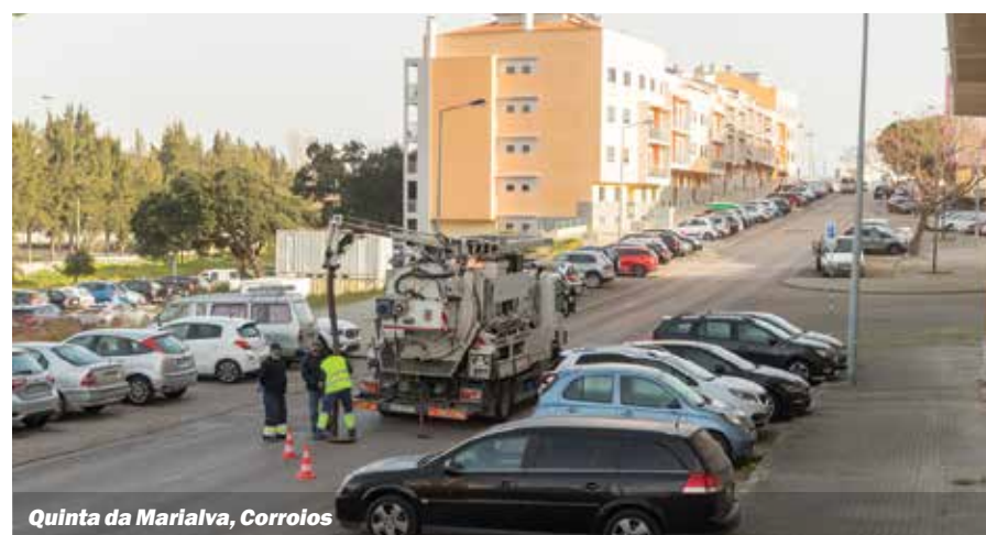
Quinta da Marialva, Corrolos