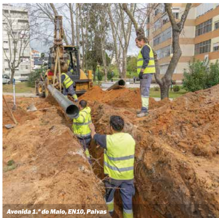
Avenida 1.º de Maio, EN10, Paivas

Amora, Fernão Ferro e Aldeia de Paio Pires