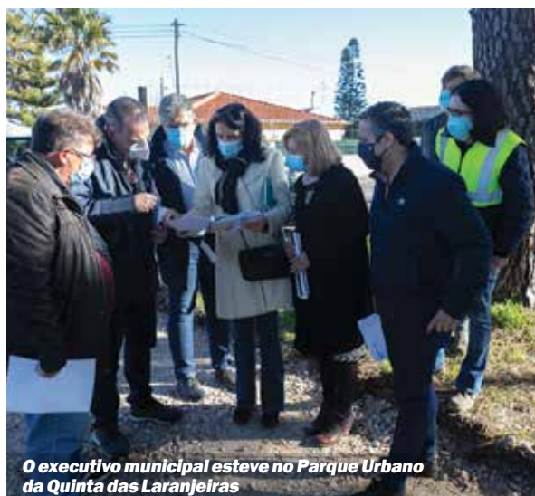
O executivo municipal esteve no Parque Urbano da Quinta das Laranjeiras