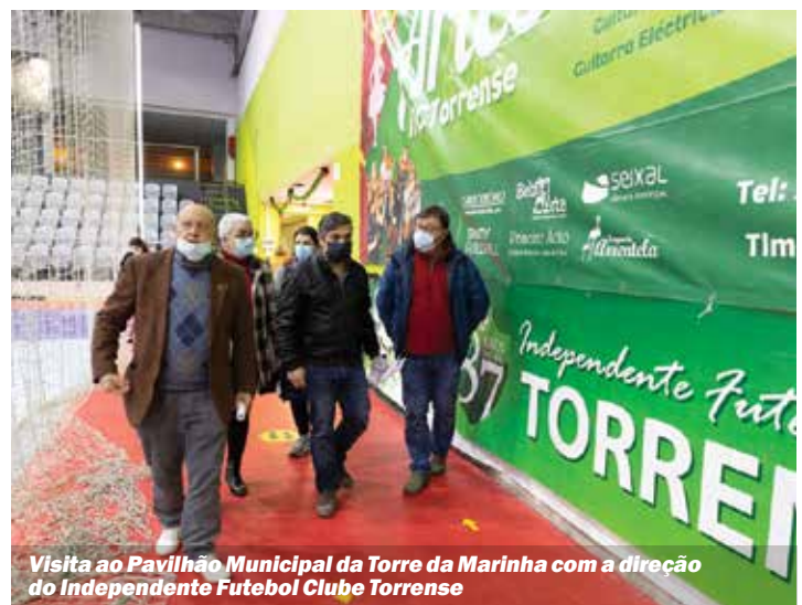
Visita ao Pavilhão Municipal da Torre da Marinha com a direção do Independente Futebol Clube Torrense