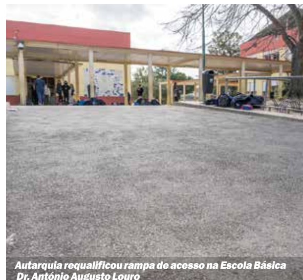
Autarquia requalificou rampa de acesso na Escola Básica Dr. António Augusto Louro