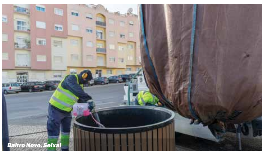
Bairro Novo, Seixal