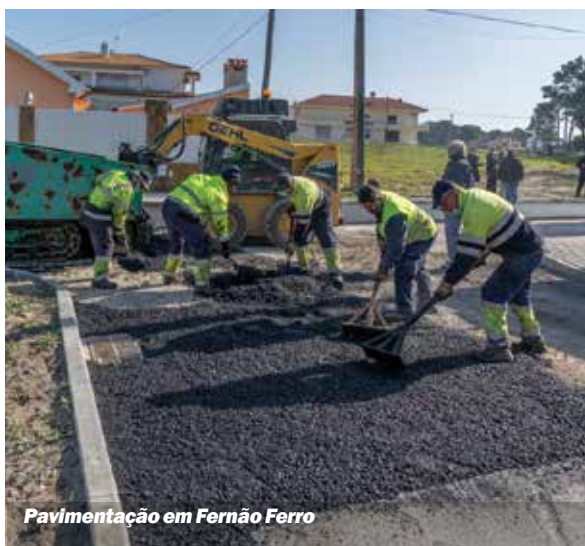
Pavimentação em Fernão Ferro