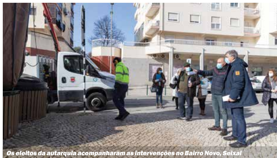
Os eleitos da autarquia acompanharam as intervenções no Bairro Novo, Seixal