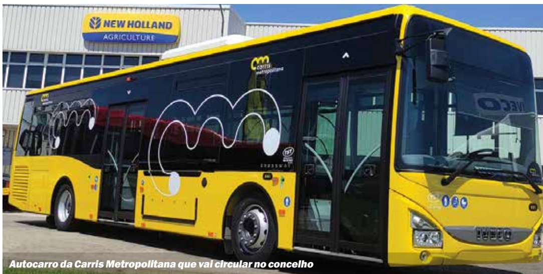
Autocarro da Carris Metropolitana que vai circular no concelho