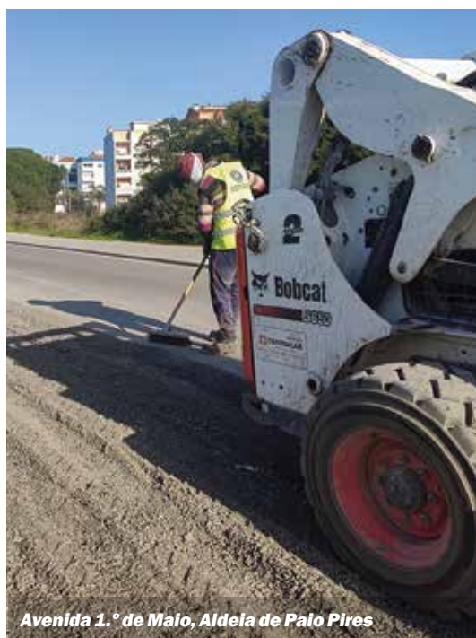
Avenida 1.º de Maio, Aldeia de Paio Pires