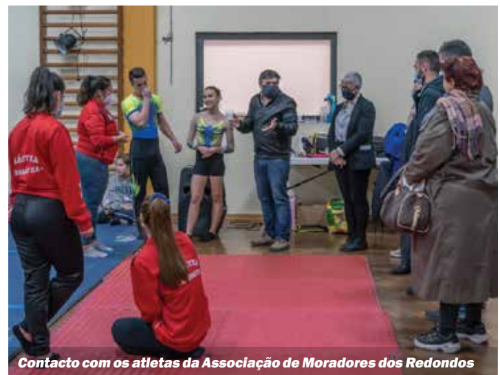
Contacto com os atletas da Associação de Moradores dos Redondos