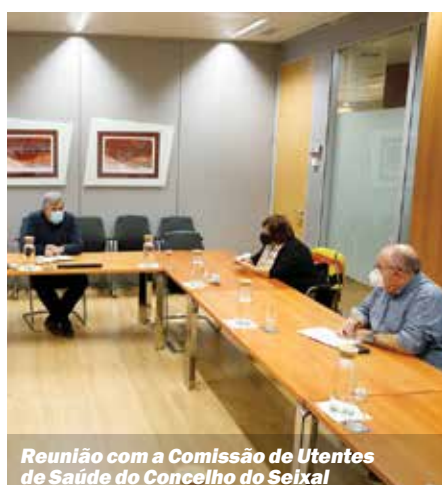
Reunião com a Comissão de Utentes de Saúde do Concelho do Seixal