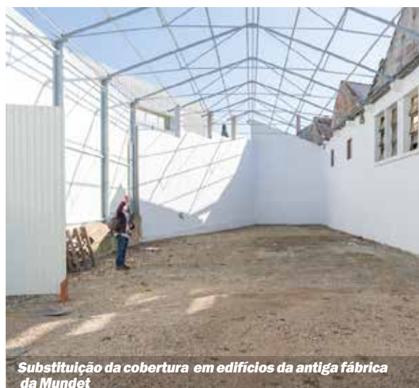
Substituição da cobertura em edifícios da antiga fábrica da Mundet