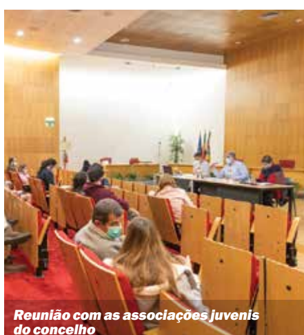
Reunião com as associações juvenis do concelho