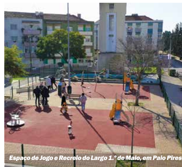
Espaço de Jogo e Recreio do Largo 1.º de Maio, em Palo Pires