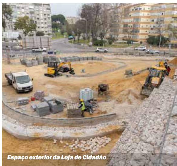
Espaço exterior da Loja de Cidadão