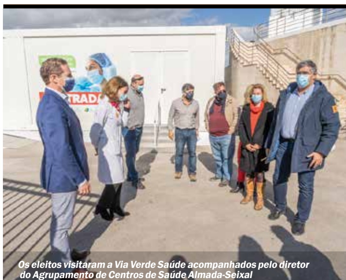
Os eleitos visitaram a Via Verde Saúde acompanhados pelo diretor do Agrupamento de Centros de Saúde Almada-Seixal