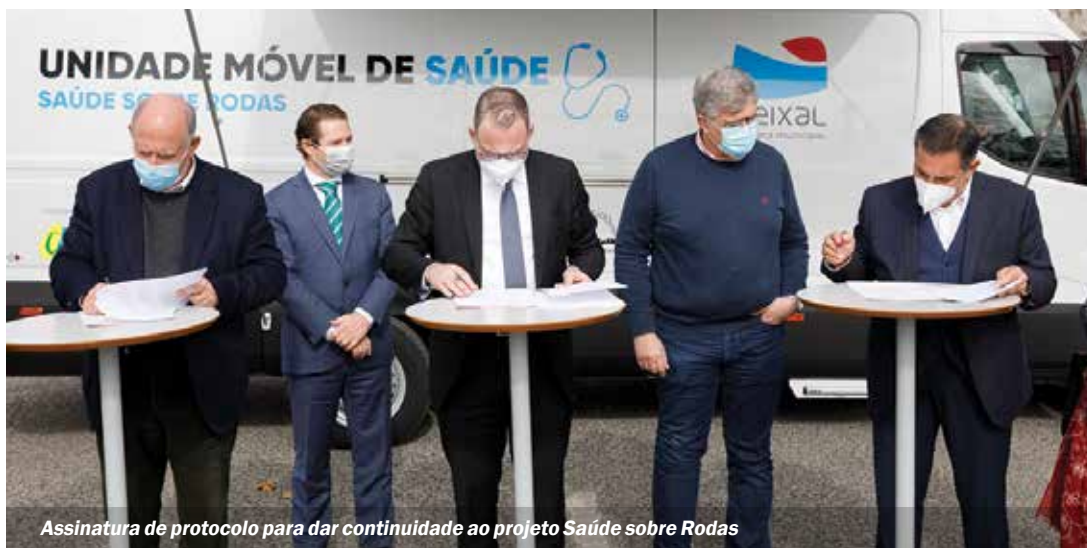
Assinatura de protocolo para dar continuidade ao projeto Saúde sobre Rodas

O horário de funcionamento da Via Verde Saúde no concelho do Seixal é o seguinte: de segunda a sexta-feira, das 8 às 20 horas.