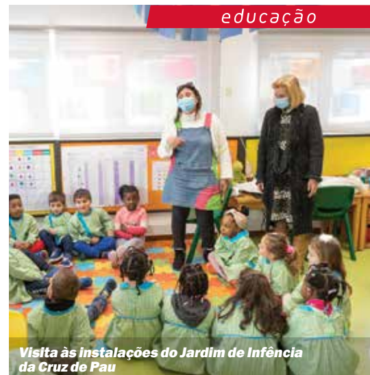
Visita às instalações do Jardim de Infância da Cruz de Pau