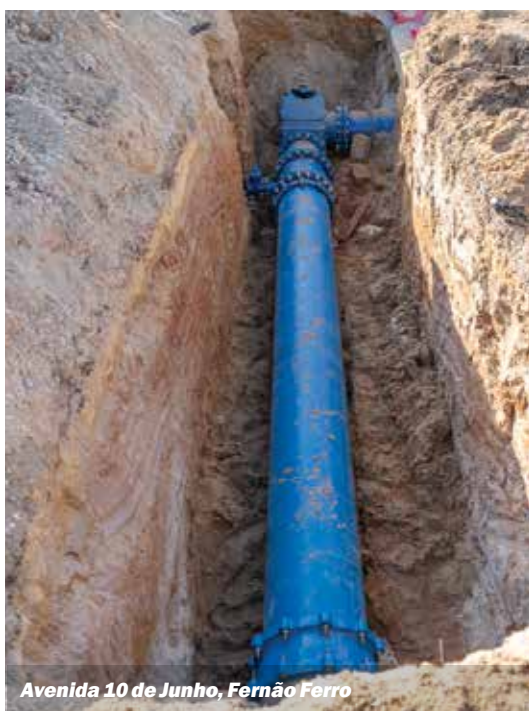
Avenida 10 de Junho, Fernão Ferro