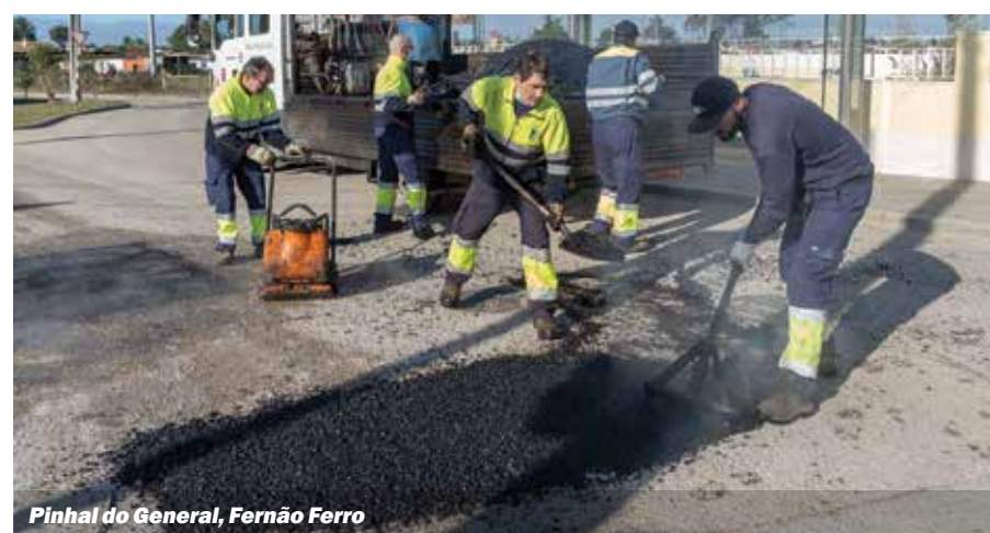
Pinhal do General, Fernão Ferro