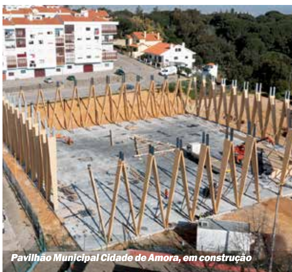
Pavilhão Municipal Cidade de Amora, em construção