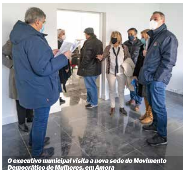
O executivo municipal visita a nova sede do Movimento Democrático de Mulheres, em Amora