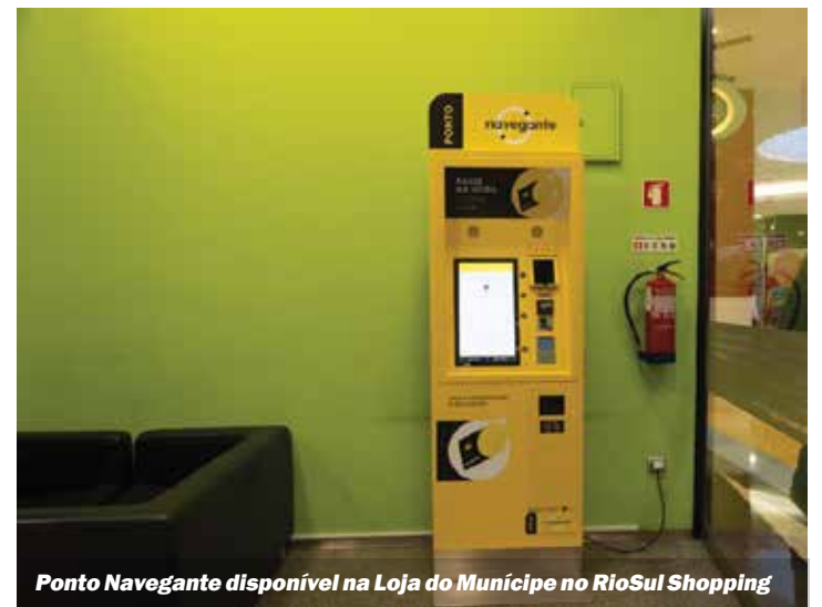
Ponto Navegante disponível na Loja do Município no RioSul Shopping

Câmara Municipal do Seixal investe 2,7 milhões de euros por ano