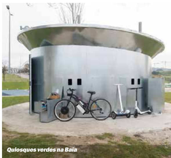
Quiosques verdes na Baía