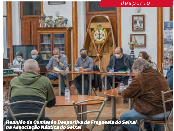
Reunião da Comissão Desportiva de Freguesia do Seixal na Associação Náutica do Seixal