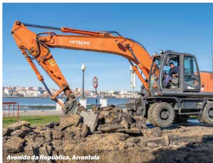
Avenida da República, Arrentela