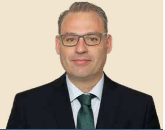
Joaquim Santos Presidente da Câmara

Em fevereiro, o Município do Seixal voltou à Nauticampo, na Feira Internacional de Lisboa, no Parque das Nações, e vai estar igualmente na Bolsa de Turismo de Lisboa, que decorre entre 16 e 20 de março.