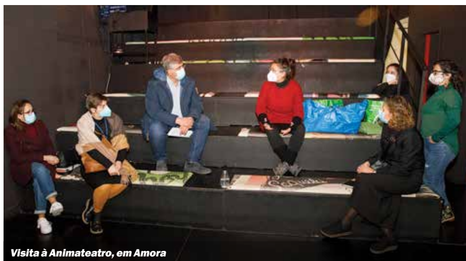
Visita à Animateatro, em Amora