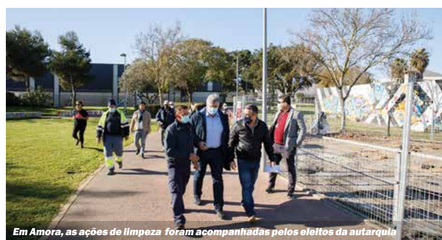
Em Amora, as ações de limpeza foram acompanhadas pelos eleitos da autarquia