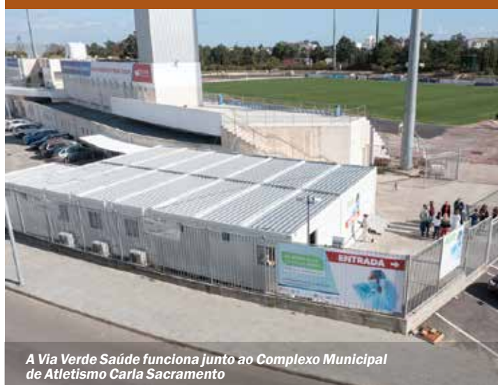
A Via Verde Saúde funciona junto ao Complexo Municipal de Atletismo Carla Sacramento