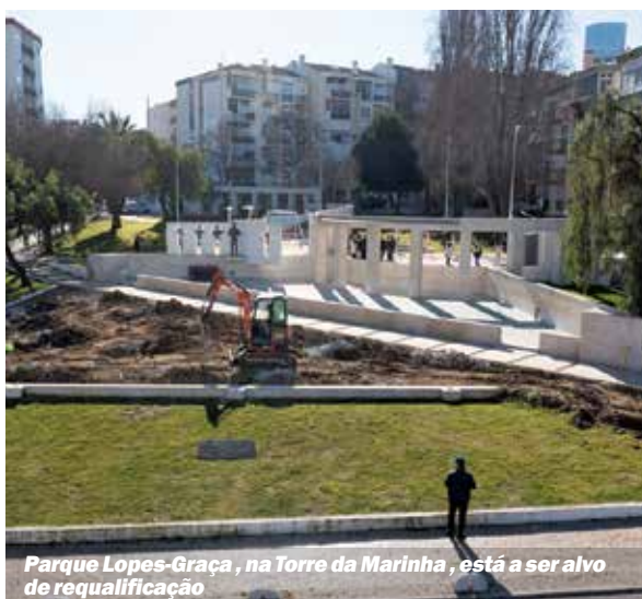
Parque Lopes-Graça, na Torre da Marinha, está a ser alvo de requalificação