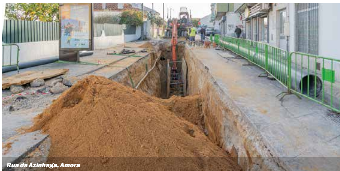
Rua da Azinhaga, Amora