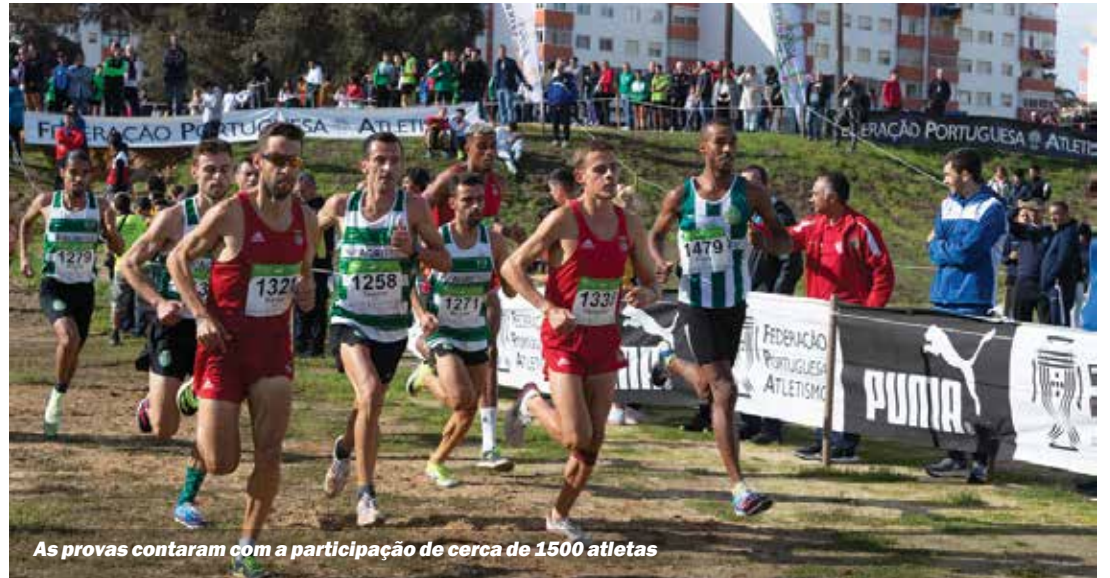
As provas contaram com a participação de cerca de 1500 atletas

Para acompanhar as classificações do torneio consulte a página de Facebook do clube. Pode ainda consultar os calendários atualizados dos jogos.