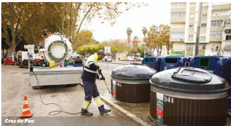
Cruz de Pau