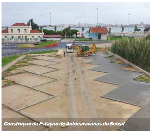
Construção da Estação de Autocaravanas do Seixal