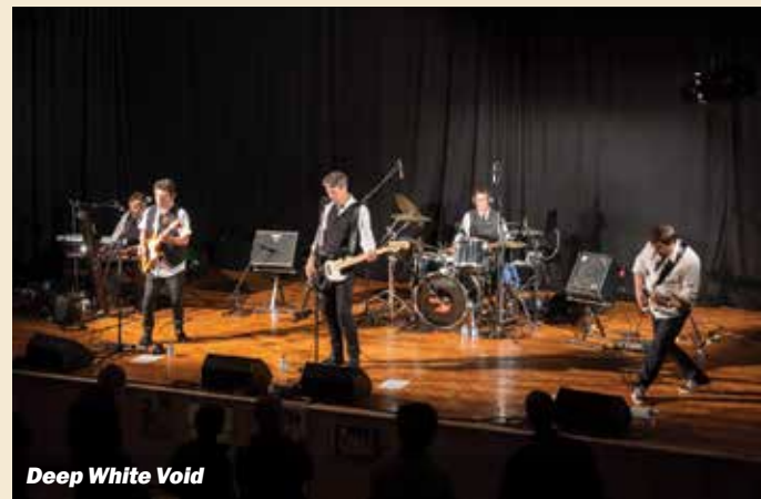
Deep White Void

palcos para comemorar os 10 anos do lançamento do seu último álbum, «Música Bipolar Portuguesa». Os Deep White Void são uma banda portuguesa de rock alternativo, de Lisboa, formada em 2008 por alguns elementos dos antigos K4 Quadrado Azul, Essa Entente e Aix-la-Chapelle e que têm três álbuns em carteira.