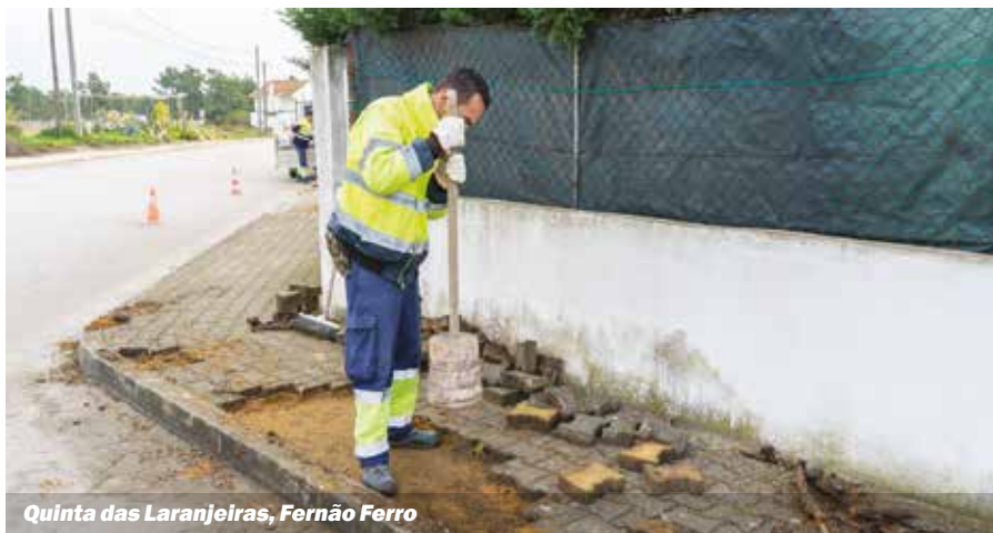
Quinta das Laranjeiras, Fernão Ferro