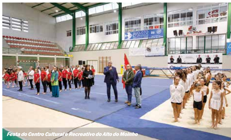
Festa do Centro Cultural e Recreativo do Alto do Moinho