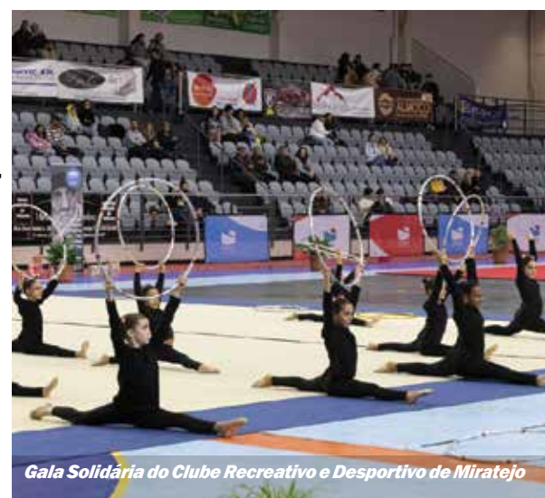
Gala Solidária do Clube Recreativo e Desportivo de Miratejo

A época de Natal é propícia a festas de celebração e os clubes e instituições não fugiram à tradição. Com o final do ano a aproximar-se, foi altura de mostrar o trabalho desenvolvido, com espetáculos, demonstrações desportivas e convívios. O executivo municipal acompanhou estas celebrações.