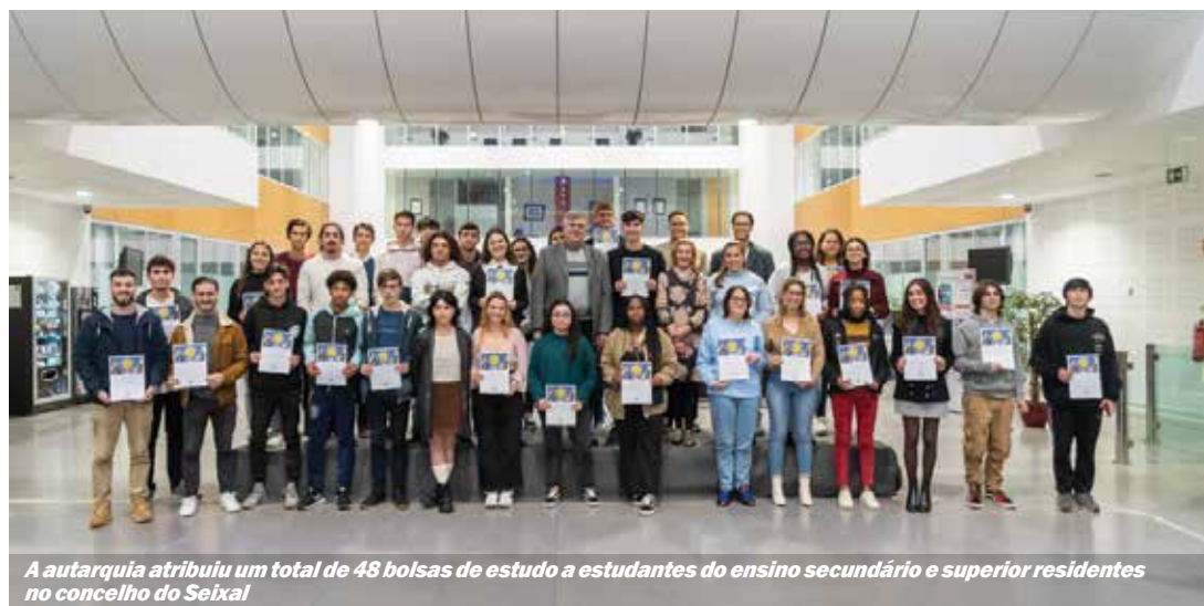
A autarquia atribuiu um total de 48 bolsas de estudo a estudantes do ensino secundário e superior residentes no concelho do Seixal