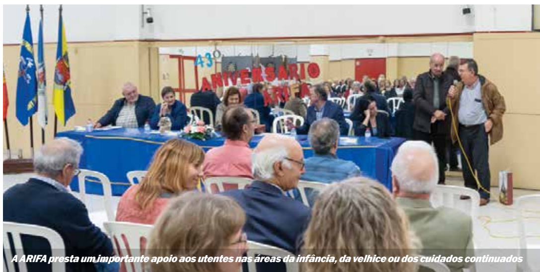
A ARIFA presta um importante apoio aos utentes nas áreas da infância, da velhice ou dos cuidados continuados

A celebração de aniversário incluiu uma cerimónia eucarística em que foram realizadas as promessas de dirigentes e caminheiros e a investidura de novos guias. Após a eucaristia, já nas instalações do agrupamento, procedeu-se à formatura dos elementos e decorreu um almoço partilhado e o corte do bolo de aniversário.