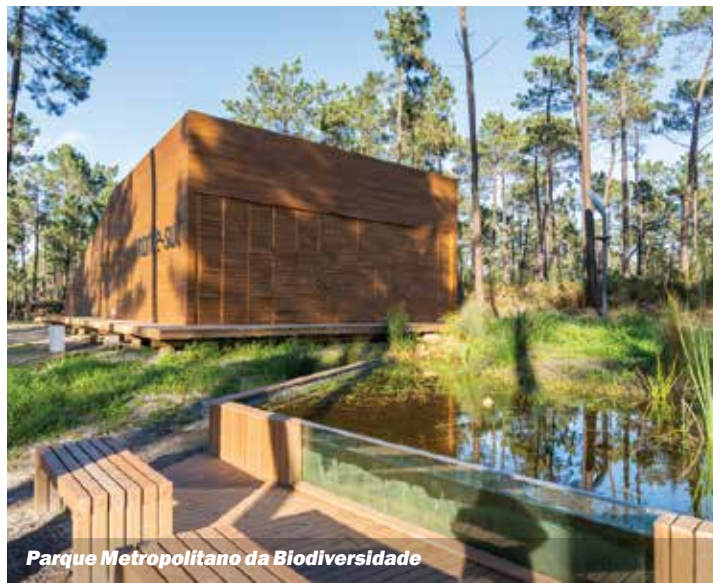
Parque Metropolitano da Biodiversidade