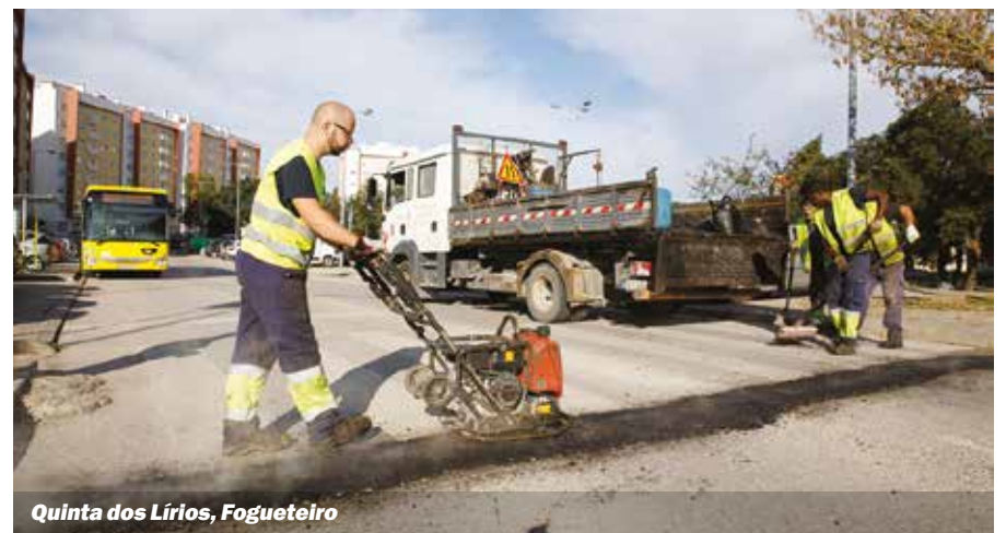
Quinta dos Lirios, Fogueteiro