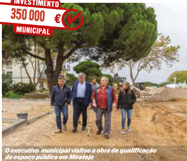
O executivo municipal visitou a obra de qualificação do espaço público em Miratejo