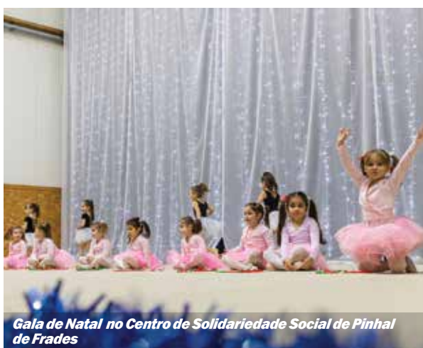
Gala de Natal no Centro de Solidariedade Social de Pinhal de Frades