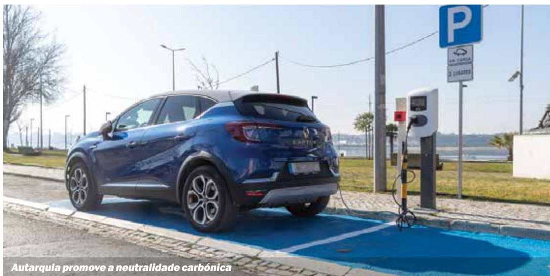
Autarquia promove a neutralidade carbónica

Se é proprietário de um terreno rural (florestal ou agrícola) tem até ao dia 30 de abril para proceder à sua limpeza. Caso precise de esclarecer alguma dúvida, contacte o Gabinete Técnico Florestal, através do email seixal.limpo@cm-seixal.pt ou pelo telefone 210 976 011.