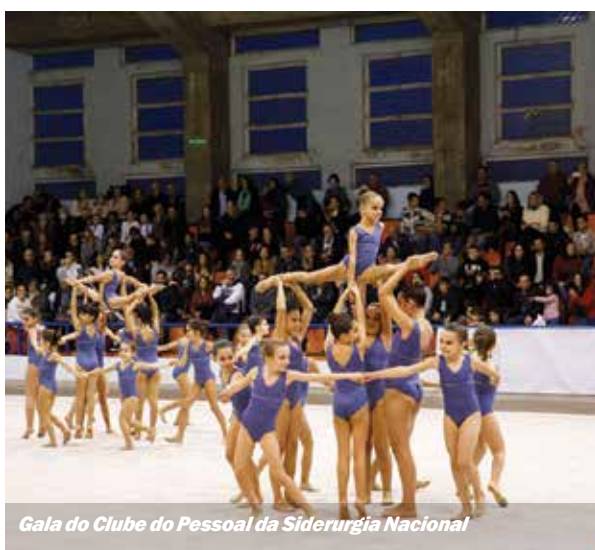
Gala do Clube do Pessoal da Siderurgia Nacional

A época de Natal é propícia a festas de celebração e os clubes e instituições não fugiram à tradição. Com o final do ano a aproximar-se, foi altura de mostrar o trabalho desenvolvido, com espetáculos, demonstrações desportivas e convívios. O executivo municipal acompanhou estas celebrações.