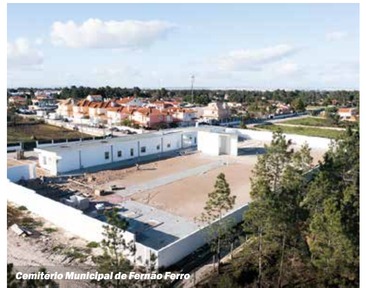
Cemitério Municipal de Fernão Ferro