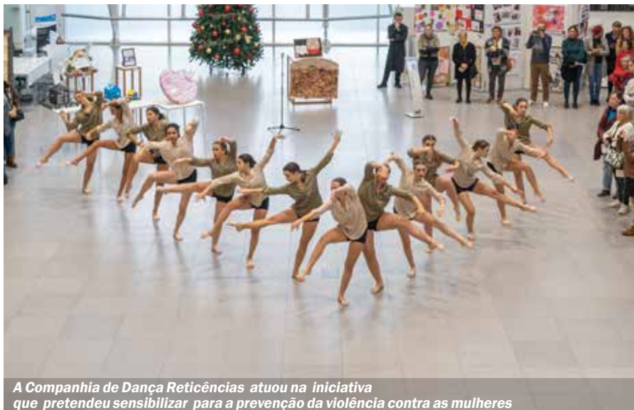
A Companhia de Dança Reticências atuou na iniciativa que pretendeu sensibilizar para a prevenção da violência contra as mulheres