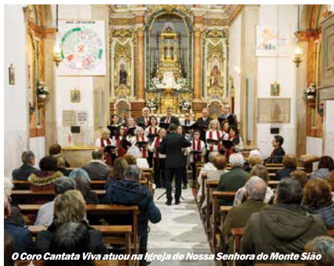
O Coro Cantata Viva atuou na Igreja de Nossa Senhora do Monte Sião