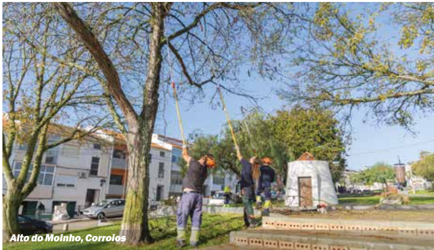
Alto do Molinho, Corroios