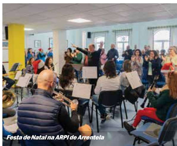
Festa de Natal na ARPI de Arrentela