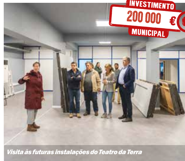
Visita às futuras instalações do Teatro da Terra