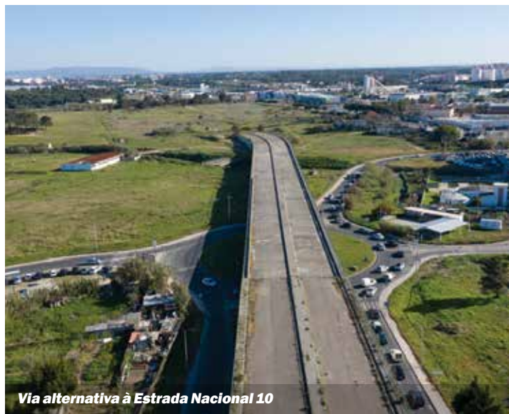
Via alternativa à Estrada Nacional 10