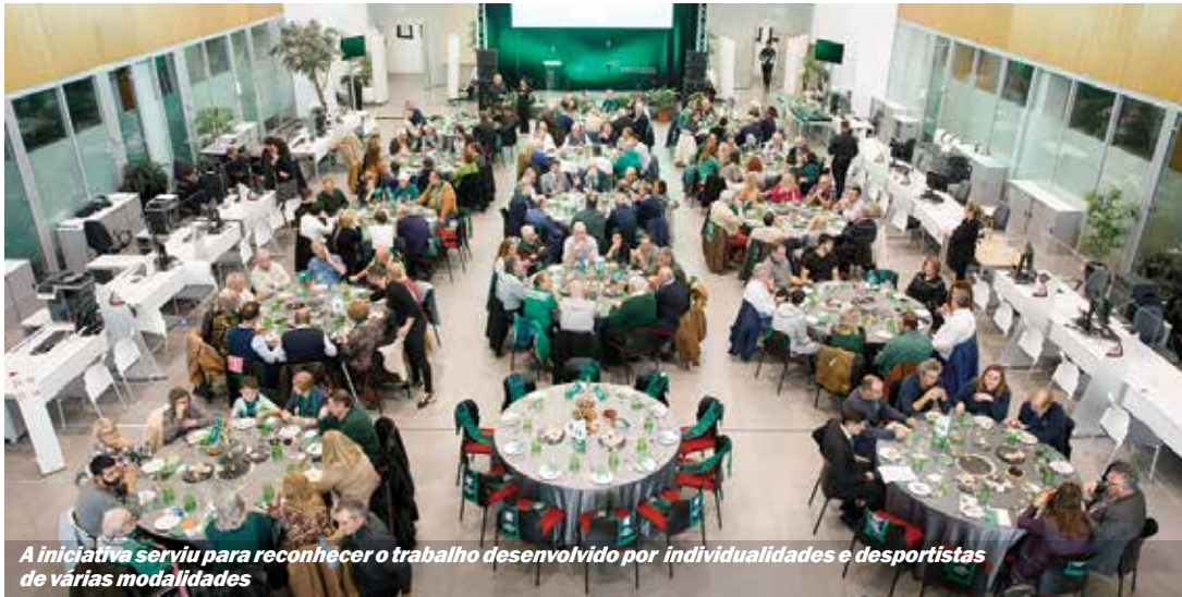
A iniciativa serviu para reconhecer o trabalho desenvolvido por individualidades e desportistas de várias modalidades