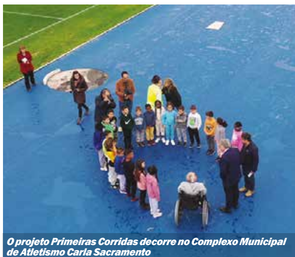
O projeto Primeiras Corridas decorre no Complexo Municipal de Atletismo Carla Sacramento