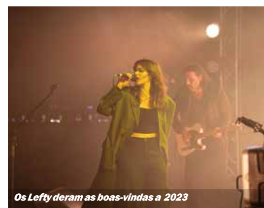
Os Lefty deram as boas-vindas a 2023