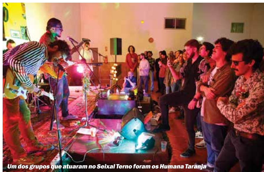
Um dos grupos que atuaram no Seixal Terno foram os Humana Taranja