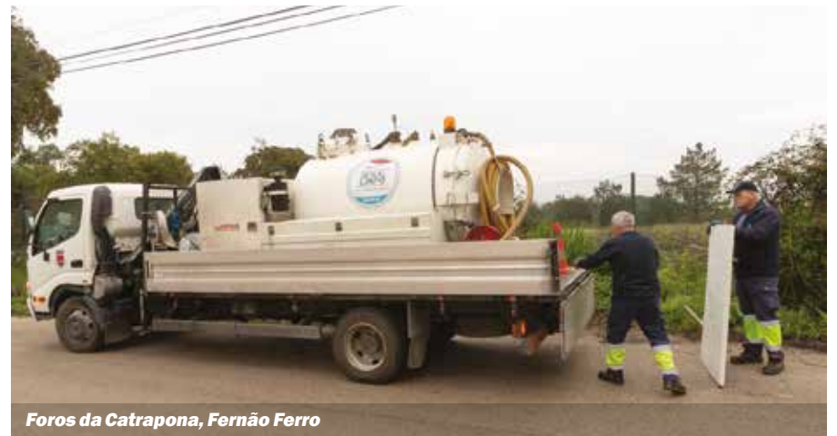
Foros da Catrapona, Fernão Ferro