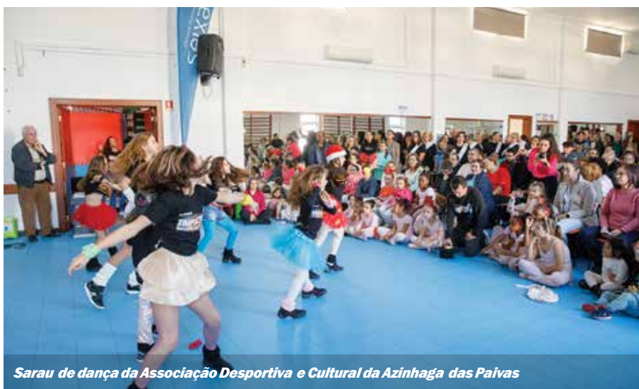
Sarau de dança da Associação Desportiva e Cultural da Azinhaça das Paivas