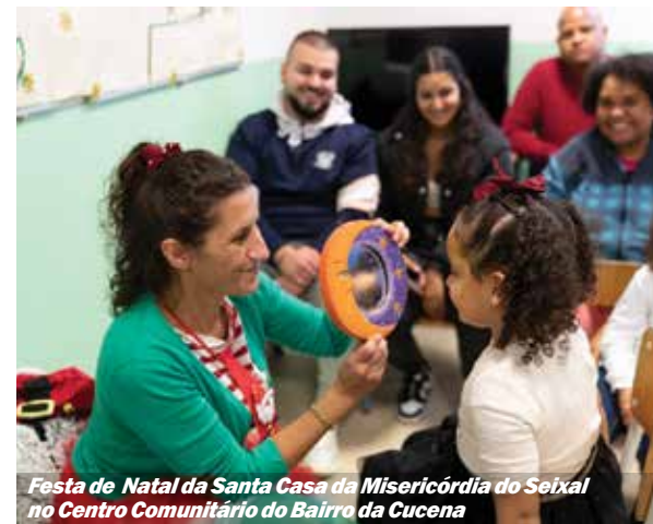
Festa de Natal da Santa Casa da Misericórdia do Seixal no Centro Comunitário do Bairro da Cucena