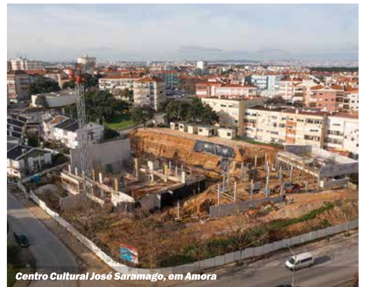
Centro Cultural José Saramago, em Amora