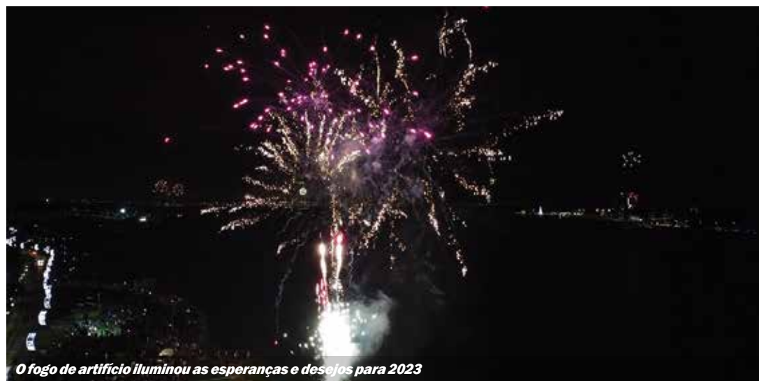
O fogo de artifício iluminou as esperanças e desejos para 2023