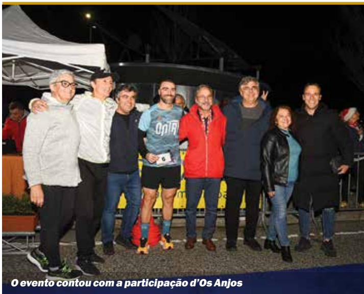
O evento contou com a participação d'Os Anjos

O Corta-Mato Cidade de Amora é um dos maiores eventos de atletismo nacionais e demonstra o trabalho realizado em conjunto com o movimento associativo e as juntas de freguesia, em prol do desenvolvimento do atletismo a nível local e nacional. A iniciativa integra o 33.º Troféu de Atletismo do Seixal e os Jogos do Seixal 2022. ■