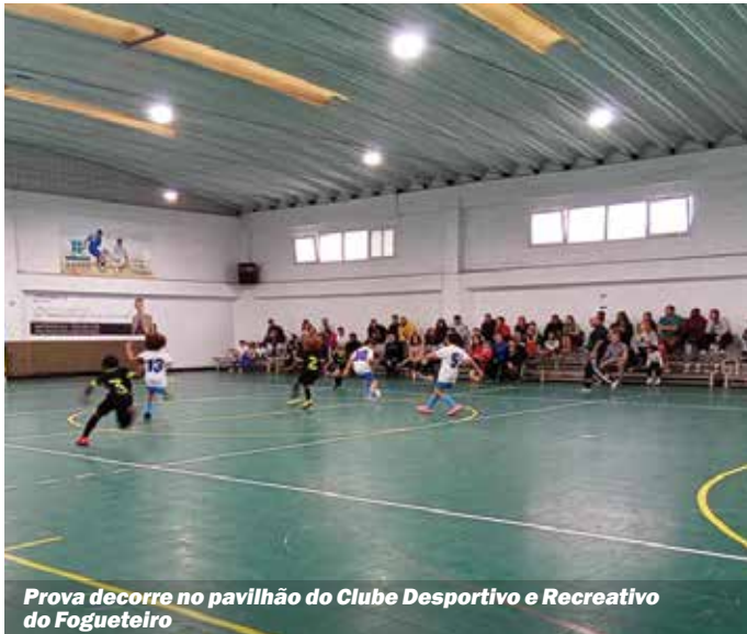
Prova decorre no pavilhão do Clube Desportivo e Recreativo do Fogueteiro