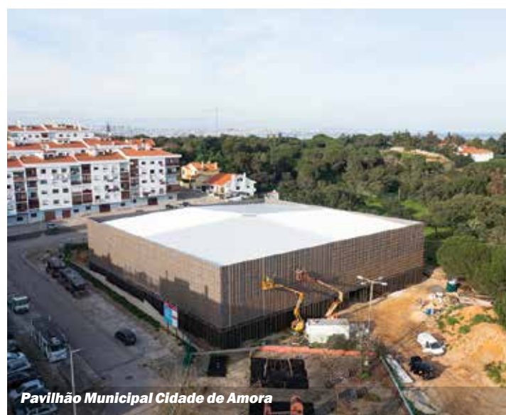
Pavilhão Municipal Cidade de Amora

O documento apostava igualmente na continuação da construção do Centro Cultural José Saramago, em