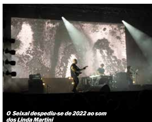
O Seixal despediu-se de 2022 ao som dos Linda Martini