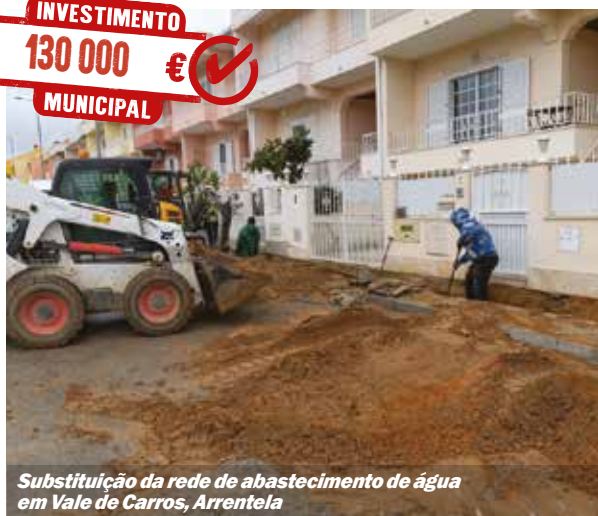
Substituição da rede de abastecimento de água em Vale de Carros, Arrentela