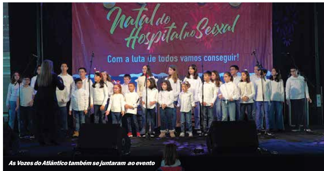
As Vozes do Atlântico também se juntaram ao evento