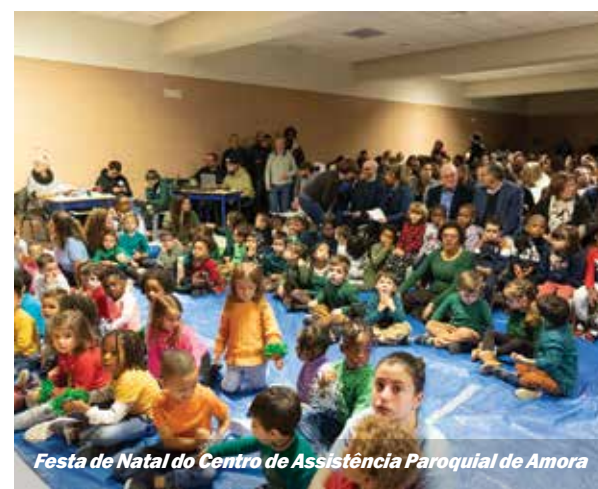
Festa de Natal do Centro de Assistência Paroquial de Amora