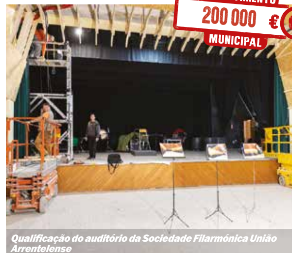
Qualificação do auditório da Sociedade Filarmónica União Arrentelense