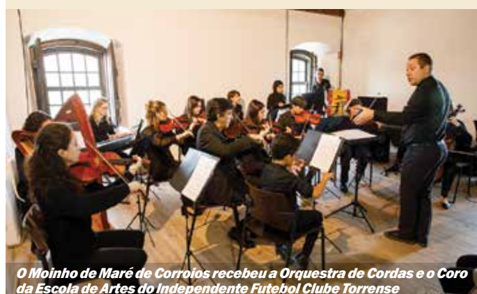
O Moinho de Maré de Corroios recebeu a Orquestra de Cordas e o Coro da Escola de Artes do Independente Futebol Clube Torrense