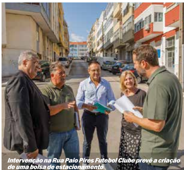
Intervenção na Rua Paio Pires Futebol Clube prevê a criação de uma bolsa de estacionamento