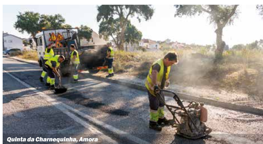
Quinta da Charnequinha, Amora