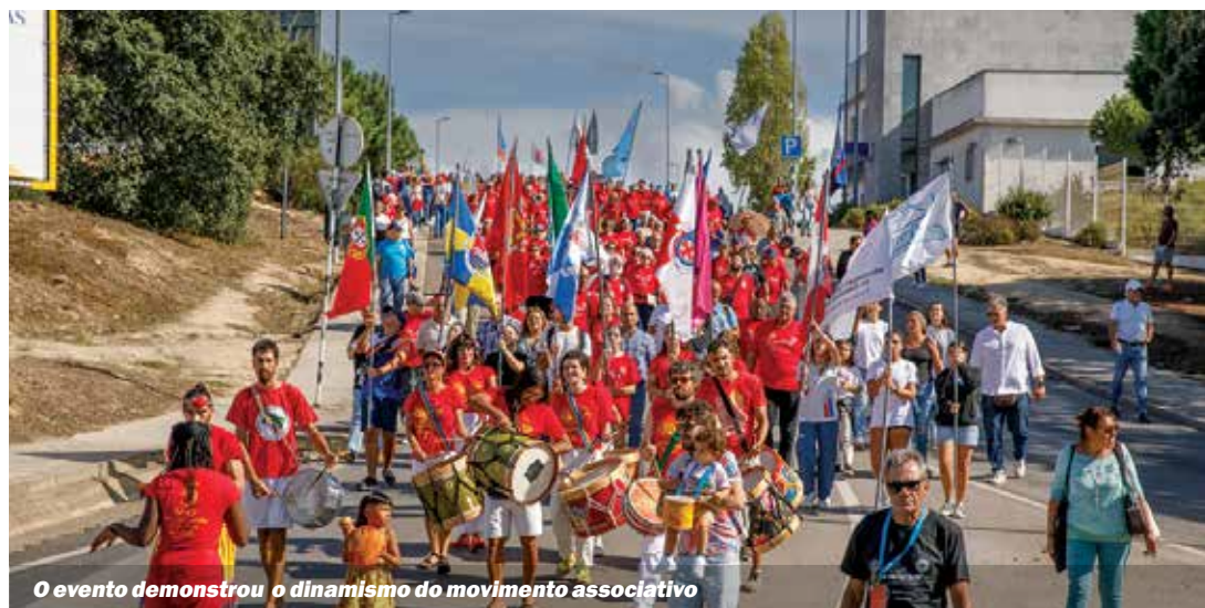
O evento demonstrou o dinamismo do movimento associativo