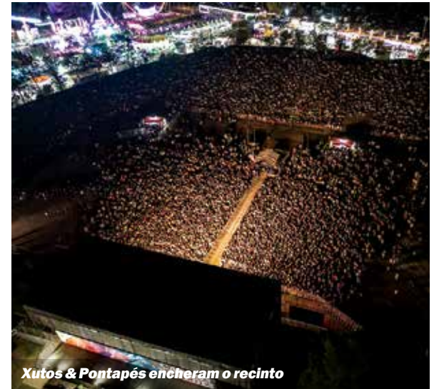
Xutos & Pontapés encheram o recinto