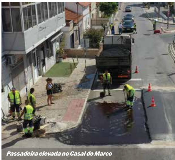
Passadeira elevada no Casal do Marco