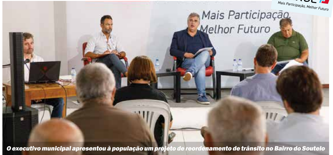
O executivo municipal apresentou à população um projeto de reordenamento de trânsito no Bairro do Soutelo

Mas este pavilhão não se limitará à utilização exclusiva da prática do voleibol. Será ainda um espaço multiusos ao serviço da freguesia e do concelho, que irá receber outras atividades desportivas, culturais e recreativas, como é o caso do Congresso da Associação Nacional de Municípios Portugueses, que se realiza no local a 30 de setembro. O Pavilhão Municipal Cidade de Amora representa um investimento da Câmara Municipal do Seixal de mais de 2 milhões de euros.