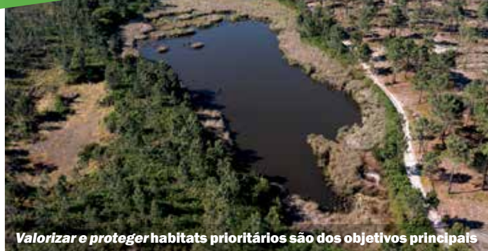
Valorizar e proteger habitats prioritários são dos objetivos principais