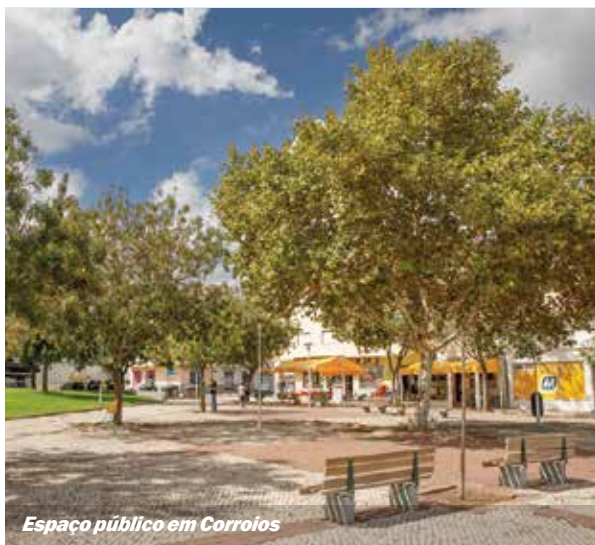
Espaço público em Corroios