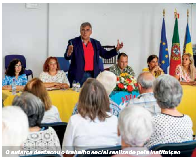
O autarca destacou o trabalho social realizado pela instituição