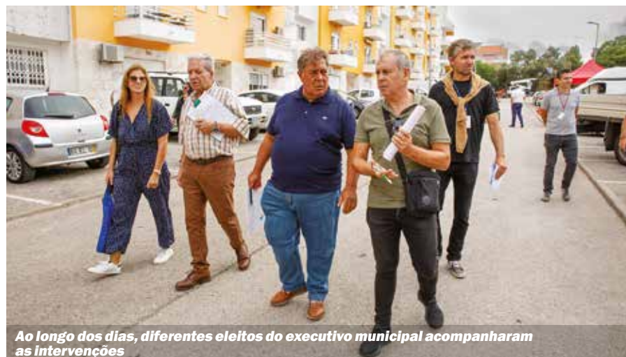
Ao longo dos dias, diferentes eleitos do executivo municipal acompanharam as intervenções

população e acompanhar os trabalhos. Nestas intervenções são realizadas ações de limpeza, desmatagem e poda de árvores, lavagem de contentores de recolha de resíduos, manutenção de papelarias, bancos de jardim, luminárias e outro mobiliário urbano, reparações de pavimento, entre outras. Para qualquer esclarecimento adicional, sugestão ou participação sobre espaço público aceda a euparticipo.seixal.pt .