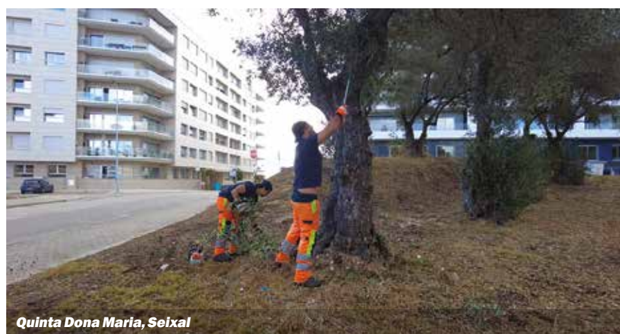
Quinta Dona Maria, Seixal