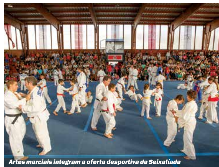
Artes marciais integram a oferta desportiva da Seixaliada

Ao longo de 40 anos a Seixaliada tem vindo a crescer, enriquecendo-se com novas modalidades e impulsionando a rentabilização de espaços desportivos, testando calendários e figurinos, contribuindo para a mobilização dos munícipes para a prática desportiva.■