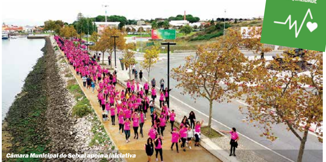
Câmara Municipal do Seixal apoia a iniciativa

Os Campeonatos Nacionais de Corta-Mato tiveram a sua estreia em maio de 1911, em Lisboa, com participação de 48 atletas, em representação de oito clubes. Em 2022, no concelho do Seixal, registaram-se as participações de 2025 atletas, com registo de 133 clubes. A competição vai ser acompanhada em direto através da transmissão pelos canais da RTP.