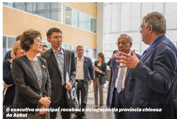
O executivo municipal recebeu a delegação da província chinesa de Anhui

em Portugal da delegação de Anhui visou «estreitar ainda mais as relações entre os nossos dois países» e afirmou que a província «está disposta a desenvolver relações bilaterais com a cidade do Seixal» nos domínios do intercâmbio de conhecimentos sobre «gestão e administração das cidades, com preocupação no bem-estar das populações»,