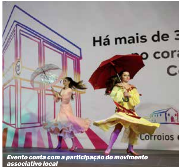
Evento conta com a participação do movimento associativo local