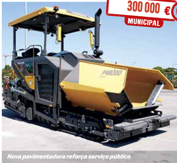
Nova pavimentadora reforça serviço público