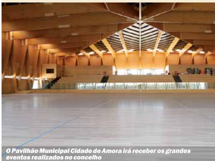
O Pavilhão Municipal Cidade de Amora irá receber os grandes eventos realizados no concelho