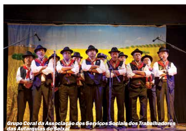
Grupo Coral da Associação dos Serviços Sociais dos Trabalhadores das Autarquias do Seixal

Durante o encontro atuaram os seguintes grupos: Grupo Coral Alentejano da Associação dos Serviços Sociais dos Trabalhadores das Autarquias do Seixal; União de Grupos Corais Alentejanos de Paio Pires e Paivas; Grupo de Cante Alentejano da Associação Unitária de Reformados, Pensionistas e Idosos da Torre da Marinha; Grupo