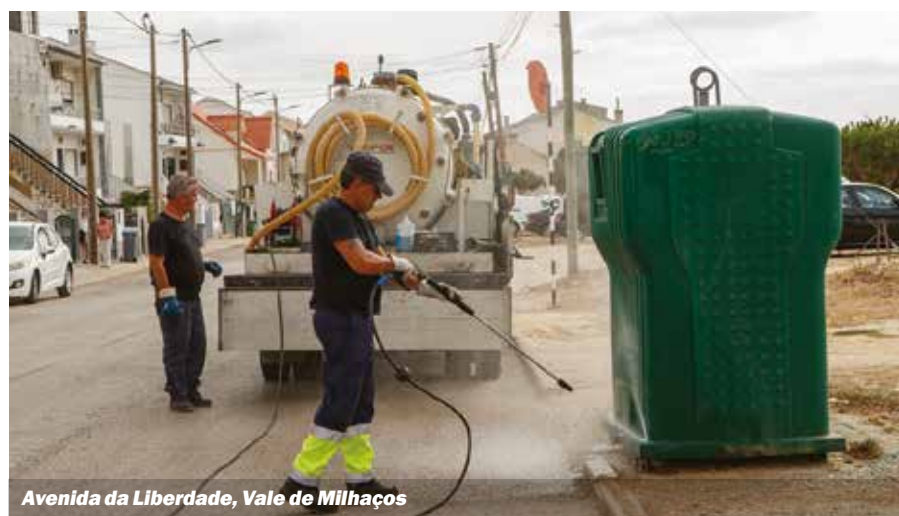
Avenida da Liberdade, Vale de Milhaços