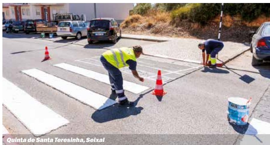
Quinta de Santa Teresinha, Seixal