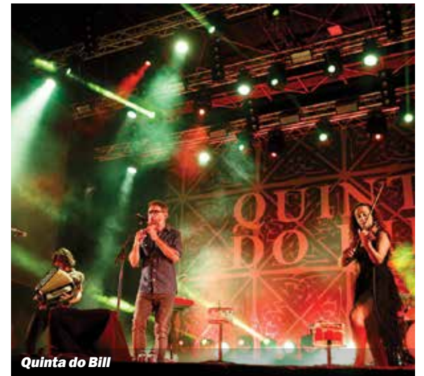
Quinta do Bill