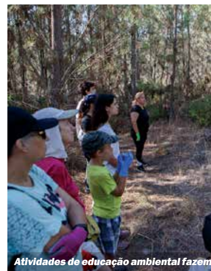
Atividades de educação ambiental fazem