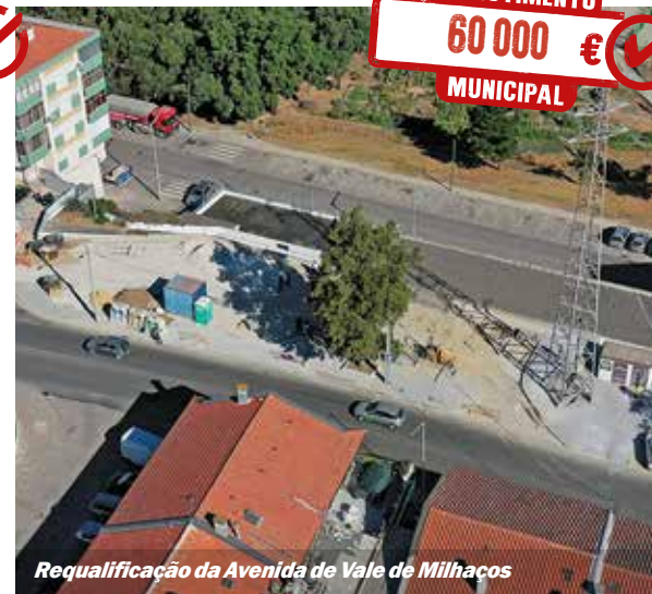
Requalificação da Avenida de Vale de Milhaços