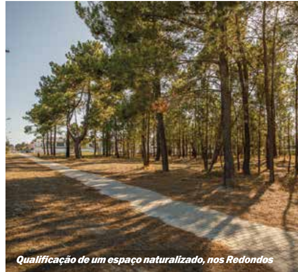
Qualificação de um espaço naturalizado, nos Redondos