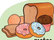
restos de pão e bolos